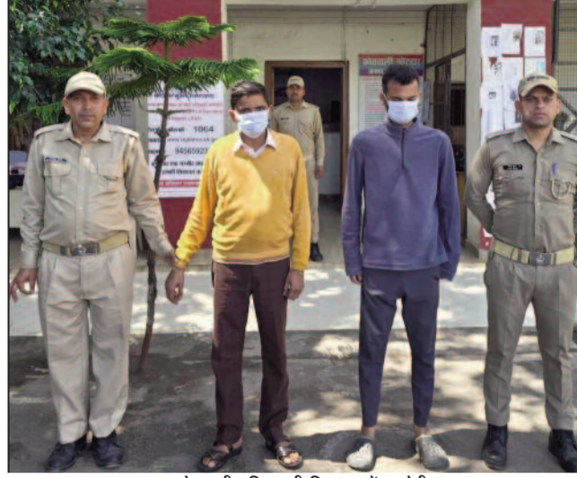
कोतवाली पुलिस की हिरासत में आरोपी