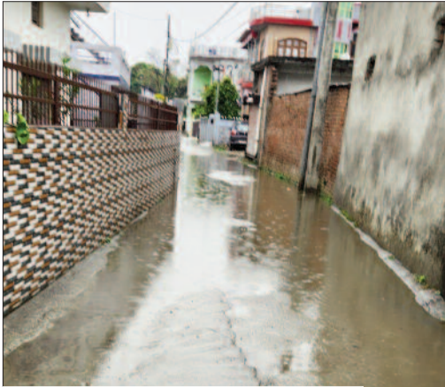
कोटद्वार के देवी रोड स्थित एक बाई में तालाब बनी सड़क

तालाब में तब्दील हो गई हैं। सड़क पर जल निकासी की कोई व्यवस्था तक नहीं बनाई गई है। जलभराव के कारण राहगीरों को परेशानियों का सामना करना पड़ रहा है। यदि समय रहते व्यवस्थाओं को बेहतर नहीं बनाया गया तो समस्या वर्षा काल में विकराल होगी।