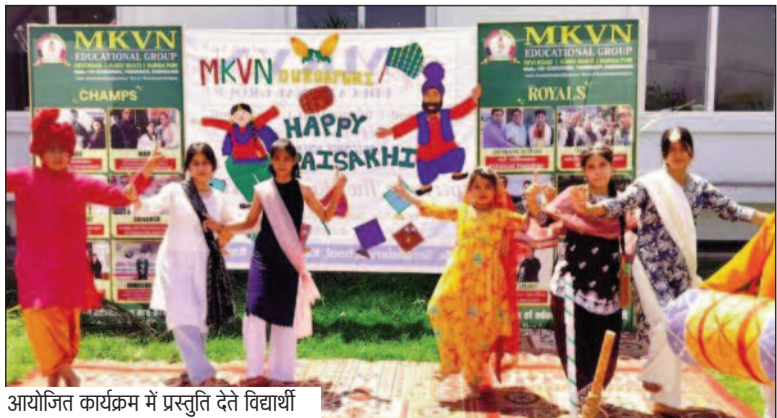
आयोजित कार्यक्रम में प्रस्तुति देते विद्यार्थी

जयन्त प्रतिनिधि। कोटद्वार। एमकेवीएन ऐजुकेशनल ग्रुप के कण्वघाटी, देवी रोड़ व दुर्गापुर स्थित विद्यालयों में बैसाखी व अंबेडकर जयंती बड़े धूमधाम से मनायी गई। इस