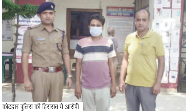
कोटद्वार पुलिस की हिरासत में आरोपी