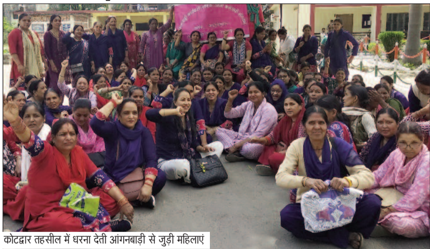
कोटद्वार तहसील में धरना देती आंगनबाड़ी से जुड़ी महिलाएं