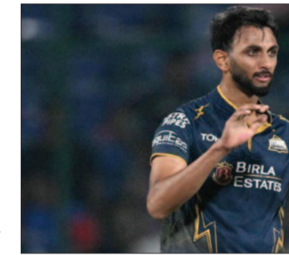
LSG vs RCB

मैच की बात करें तो तेज गेंदबाज प्रसिद्ध कृष्णा (चार ओवर में 28 रन पर चार विकेट) की अपूर्वा में गेंदबाजों के शानदार प्रदर्शन के बाद कप्तान शुभमन गिल और जोस बटलर की कमाल की बल्लेबाजी से गुजरात टाइटन्स ने इंडियन प्रीमियर लीग टी20 मैच में रविवार को यहां लखनऊ सुपर