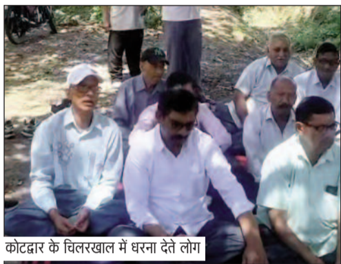
कोटद्वार के चिलरखाल में धरना देते लोग