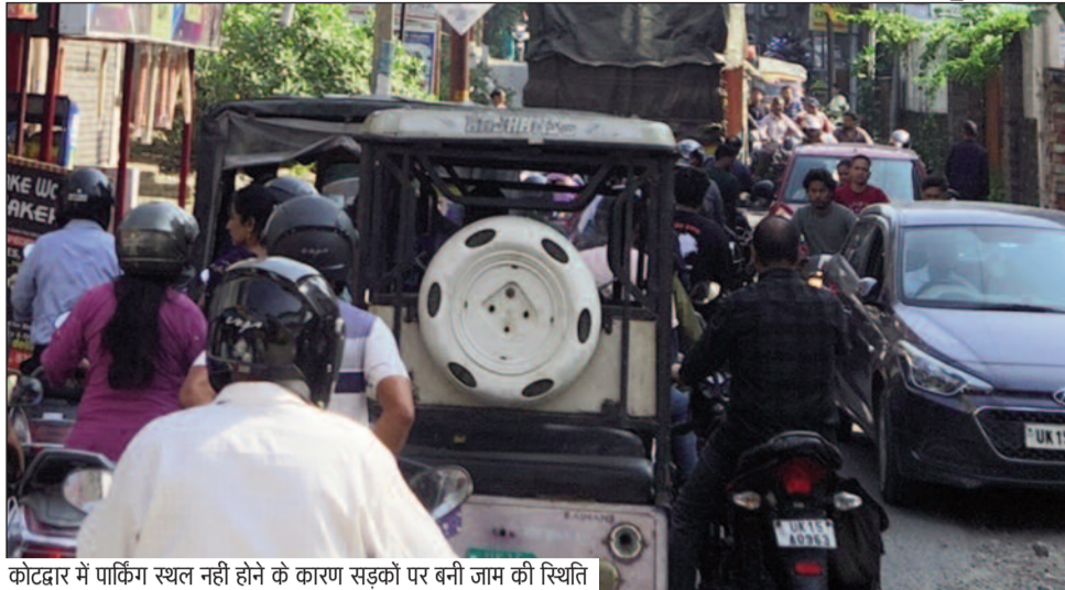
कोटद्वार में पार्किंग स्थल नही होने के कारण सड़कों पर बनी जाम की स्थिति