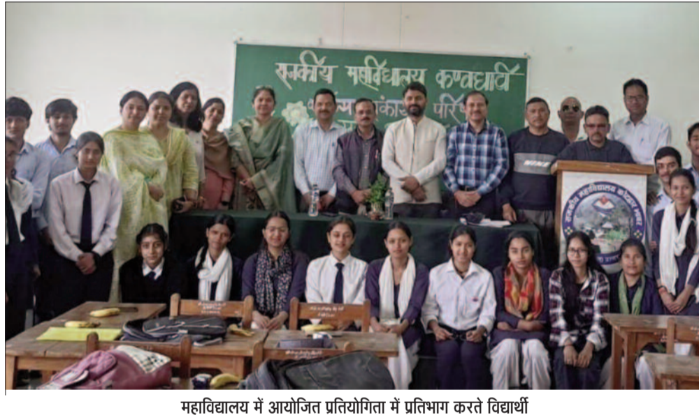
महाविद्यालय में आयोजित प्रतियोगिता में प्रतिभाग करते विद्यार्थी