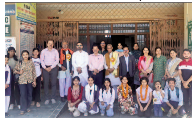
आयोजित कार्यशाला में भाग लेते विद्यार्थी