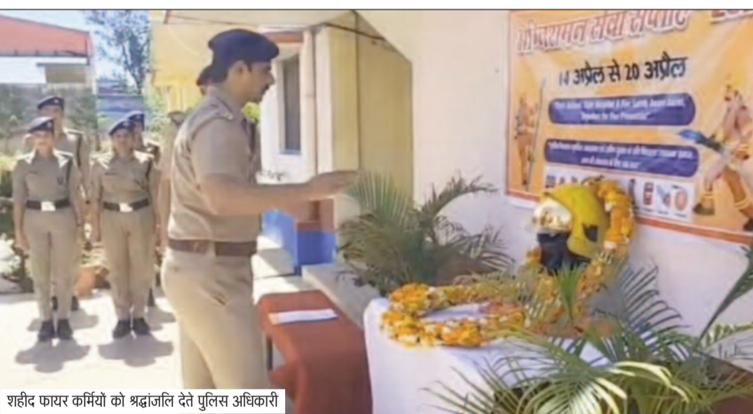
शहीद फायर कर्मियों को श्रद्धांजलि देते पुलिस अधिकारी