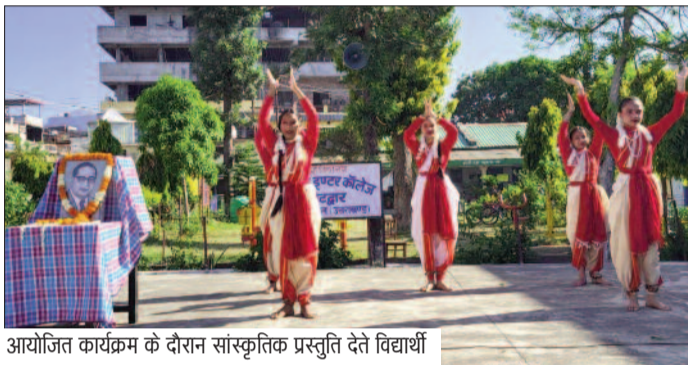
आयोजित कार्यक्रम के दौरान सांस्कृतिक प्रस्तुति देते विद्यार्थी