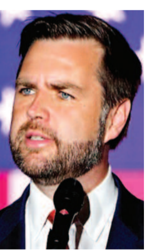
लेने की क्षमता नहीं थी। वेंस ने कहा कि ईरानी टीम को कई फैसलों के लिए तेहरान से मंजूरी लेनी पड़ती है, इसलिए तुरंत समझौता नहीं हो पाया और ये वार्ता के असफल रहने का सबसे बड़ा कारण बना।

वाशिंगटन, एंजेंसी। अमेरिका और ईरान के बीच जारी तनाव के बीच अब अमेरिका के उपराष्ट्रपति जेडी वेंस का बड़ा बयान सामने आया है। उन्होंने कुछ दिन पहले इस्लामाबाद में हुए शांति वार्ता के असफल रहने के असली वजहों पर जोर देते हुए कई अहम और बड़े खुलासे किए। वेंस ने कहा कि बातचीत पूरी तरह विफल नहीं हुई, बल्कि इसमें कुछ प्रगति जरूर हुई है। दूसरी ओर वेंस ने इस बात पर भी जोर दिया कि शांति वार्ता को लेकर अमेरिका का रुख पूरी तरह से साफ है और अब बाकी ईरान को अपना फैसला लेने की है। वेंस ने इस बात को ऐसे कहा कि अमेरिका ने बातचीत को लेकर अपना रुख साफ कर दिया है और अब गैर ईरान के पाले में है।