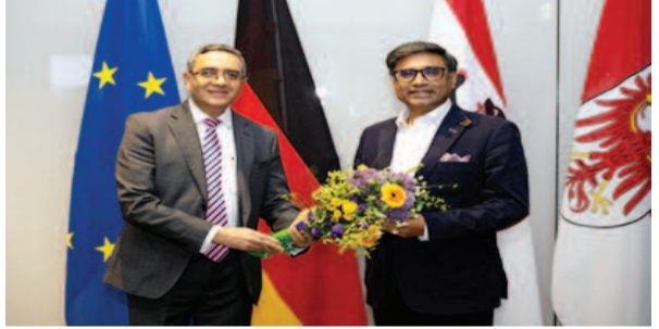
भारतीय विदेश सचिव विक्रम मिश्री का बर्लिन में स्वागत किया। भारतीय राजदूत ने 'एक्स' पोस्ट में कहा, 'उनकी यह यात्रा भारत-जर्मनी रणनीतिक साझेदारी के संपूर्ण दायरे की समीक्षा करेगी, द्विपक्षीय एजेंडे के प्रमुख स्तंभों पर चर्चा को आगे बढ़ाने व क्षेत्रीय और वैश्विक घटनाक्रमों पर विचारों का आदान-प्रदान करने का एक अवसर प्रदान करती है।' इससे पहले, विदेश मंत्रालय (एमईए) ने उनकी यात्रा की घोषणा करते हुए