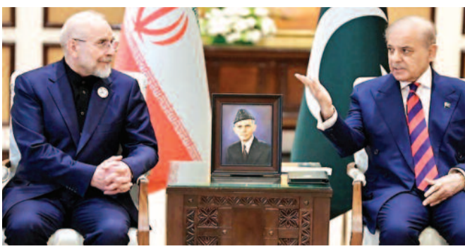
अमेरिकी अधिकारियों ने जिनेवा (स्विट्जरलैंड) की भी एक संभावित विकल्प बताया है। हालांकि, अभी तक स्थान और समय को लेकर कोई अंतिम निर्णय नहीं लिया गया है, लेकिन सूत्रों का मानना है कि यह वार्ता गुरुवार को हो सकती है।

जिनेवा, एंजेंसी। अमेरिका और ईरान जल्द ही दूसरे दौर की कूटनीतिक वार्ता शुरू कर सकते हैं। दोनों देशों के बीच पिछले छह हफ्तों से चल रहे युद्ध को समाप्त करने के लिए यह एक महत्वपूर्ण कदम माना जा रहा है। दो अमेरिकी अधिकारियों और घटनाक्रम की जानकारी रखने वाले एक अन्य व्यक्ति के अनुसार, दोनों देश अगले सप्ताह मौजूदा युद्धविराम के समाप्त होने से पहले एक समझौते तक पहुंचने की कोशिश कर रहे हैं। इसके लिए वे आमने-सामने बैठकें नहीं बातचीत करने पर विचार कर रहे हैं। एसोसिएटेड प्रेस के सूत्रों के अनुसार, वार्ता के नए दौर को लेकर अभी चर्चा चल ही रही है। वहीं मध्यस्थता करने वाले देशों में से एक के राजनयिक ने बड़ा दावा करते हुए कहा है कि तेहरान और वाशिंगटन बातचीत के लिए पूरी तरह सहमत हो गए हैं। इन सभी चारों सूत्रों ने कूटनीतिक संवेदनशीलता के कारण नाम न छपाने की शर्त पर एपी की यह जानकारी दी है। फिलहाल यह स्पष्ट नहीं है कि इस बार की वार्ता में भी पिछली बार के स्तर के ही उच्च अधिकारी या प्रतिनिधिमंडल हिस्सा लेंगे या नहीं।