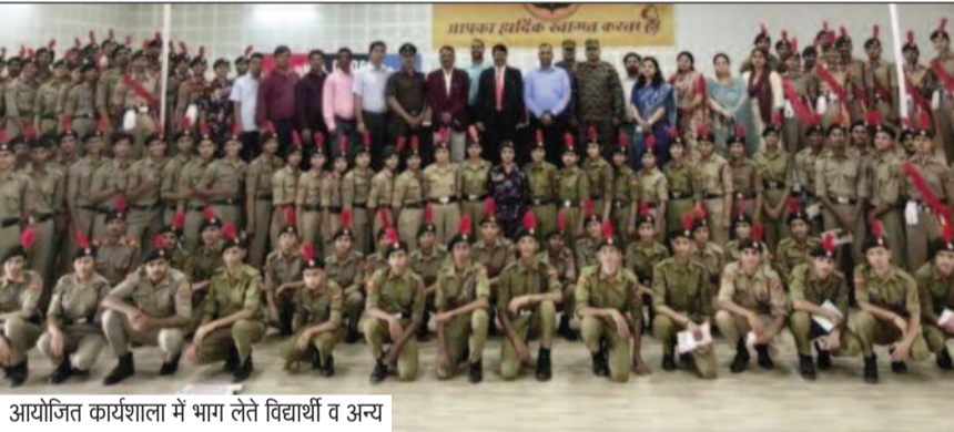
आयोजित कार्यशाला में भाग लेते विद्यार्थी व अन्य