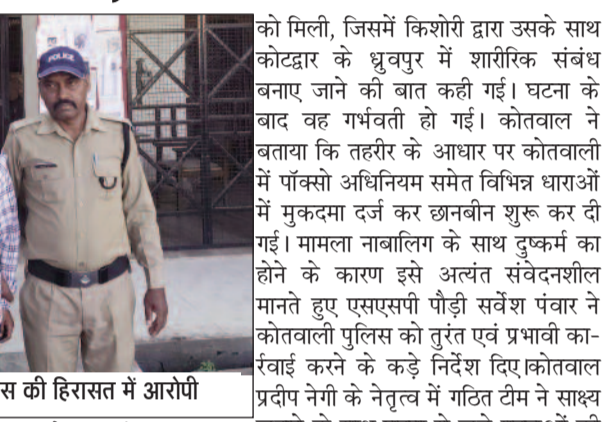
कोटद्वार कोतवाली परिसर में पुलिस की हिरासत में आरोपी