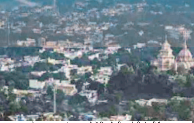
कोटद्वार शहर जहां बारात घरों में नियमों की अनदेखी हो रही है।

जयन्त प्रतिनिधि। कोटद्वार: कोटद्वार नगर निगम क्षेत्र की बात करें तो शायद ही कोई ऐसा गली-मोहल्ला हो, जहां वैडिंग प्लांटों में अग्नि सुरक्षा के नाम पर संचालित न हो रहे हैं। लेकिन, सुरक्षा मानकों की बात करें तो इन वैडिंग प्लांटों में सुरक्षा पूरी तरह भगवान भरोसे है। हालात यह हैं कि कई वैडिंग प्लांटों में अग्नि सुरक्षा के नाम पर हाईड्रेट छोड़िए, पेयजल टैंक तक नहीं