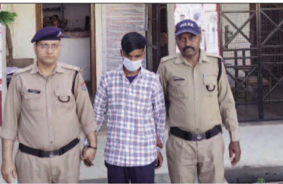
कोटद्वार कोतवाली परिसर में पुलिस की हिरासत में आरोपी