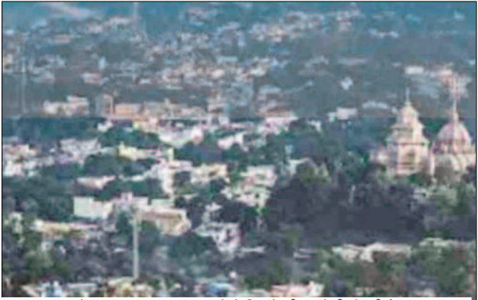
कोटद्वार शहर जहां बारात घरों में नियमों की अनदेखी हो रही है।

जयन्त प्रतिनिधि। कोटद्वार: कोटद्वार नगर निगम क्षेत्र की बात करें तो शायद ही कोई ऐसा गली- मोहल्ला हो, जहां वैडिंग प्लांट प्लांट में अग्नि सुरक्षा के नाम पर संचालित न हो रहे हैं। लेकिन, सुरक्षा मानकों की बात करें तो इन वैडिंग प्लांटों में सुरक्षा पूरी तरह भगवान भरोसे है। हालात यह हैं कि कई वैडिंग प्लांटों में अग्नि सुरक्षा के नाम पर हाईड्रेट छोड़िए, पेयजल टैंक तक नहीं