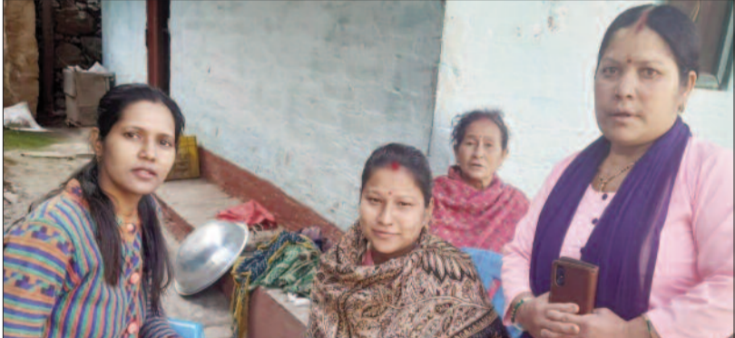
घर-घर जाकर महिलाओं की जांच करती स्वास्थ्य विभाग की टीम

जयन्त प्रतिनिधि। कोटद्वार: शत प्रतिशत संस्थागत प्रसव बढ़ाने के लिए स्वास्थ्य विभाग की ओर से अभियान चलाया जा रहा है। इसी के तहत विभिन्न विकासखंड में स्वास्थ्य विभाग की टीम ने घर-घर जाकर गर्भवती महिलाओं के स्वास्थ्य की जांच की।