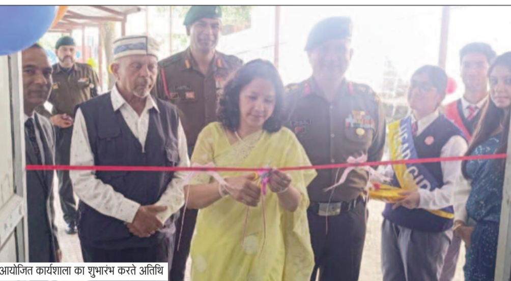
आयोजित कार्यशाला का शुभारंभ करते अतिथि

जयन्त प्रतिनिधि। कोटद्वार: आर्मी पब्लिक स्कूल, लैंसडौन में तीन दिवसीय कला प्रदर्शनी एवं कार्यशाला का भव्य शुभारंभ हुआ। इस सृजनात्मक आयोजन का उद्देश्य विद्यार्थियों में कल्पनाशीलता, रचनात्मकता और अभिव्यक्ति कौशल को विकसित करना