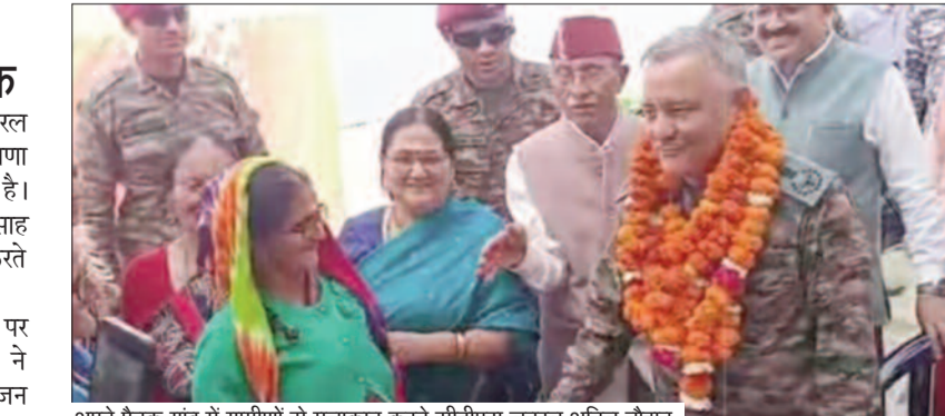
अपने पैतृक गांव में ग्रामीणों से मुलाकत करते सीडीएस जनरल अनिल चौहान

शुक्रवार को पैतृक गांव गवाण पहुंचने पर सीडीएस जनरल अनिल चौहान को लोगों ने भव्य स्वागत किया। गवाण में वह पूजन समारोह में शामिल हुए। साथ ही देवदाला स्थित सिद्धपीठ राजराजेश्वरी मंदिर में पूजा-अर्चना की। चीफ ऑफ डिफेंस स्टफ अनिल चौहान ने इससे पहले बृहस्पतिवार को माणा और हर्षिल में सेना की ओर से तैयार किए जा रहे