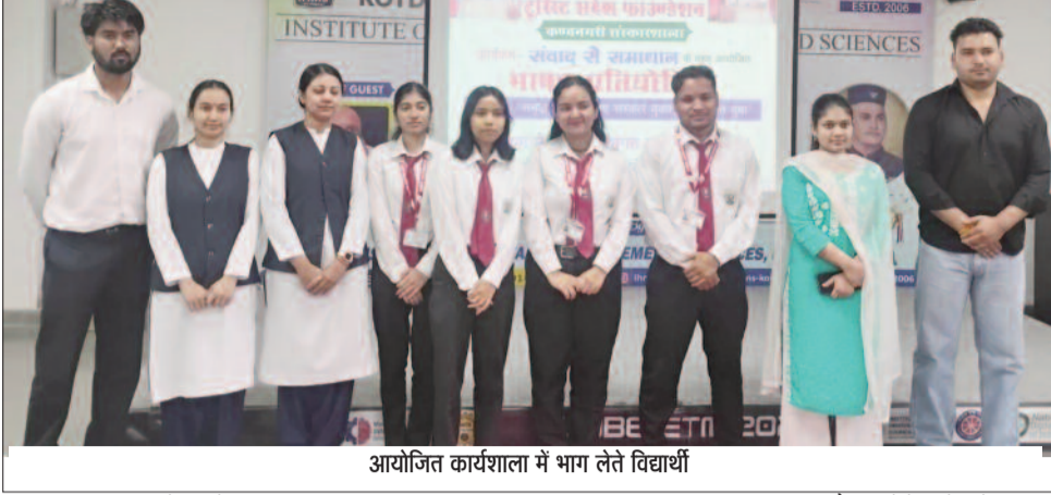
आयोजित कार्यशाला में भाग लेते विद्यार्थी

कहा कि भाजपा जल कानून के बीच रहकर जनता के लिए काम करने वाली पार्टी है। प्रधानमंत्री नरेंद्र मोदी व मुख्यमंत्री पुष्कर सिंह धामी लगातार प्रदेश के बेहतर भविष्य को संवारने पर लगे हुए हैं। पिछले कुछ वर्षों में उत्तराखंड में पर्यटकों की संख्या में इजाफा हुआ है। उत्तराखंड की बेहतर व्यवस्थाएं पर्यटकों को बेहतर लग रही हैं। प्रदेश सरकार युनिफार्म सिविल कोड लेकर आई। धर्मोत्तरण व लव