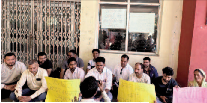
कोटद्वार बेस अस्पताल में शासन-प्रशासन के खिलाफ धरना देते लोग

जयन्त प्रतिनिधि। कोटद्वार : स्वास्थ्य सुविधाओं से जूझ रहे राजकीय बेस अस्पताल कोटद्वार की अत्यवस्थाओं पर लोगों का गुस्सा फूट पड़ा। लोगों ने सरकार के खिलाफ प्रदर्शन करते हुए व्यवस्थाओं को बेहतर बनाने की मांग उठाई। कहा कि चिकित्सकों की कमी के कारण अस्पताल रेफर सेंटर बन चुका है।