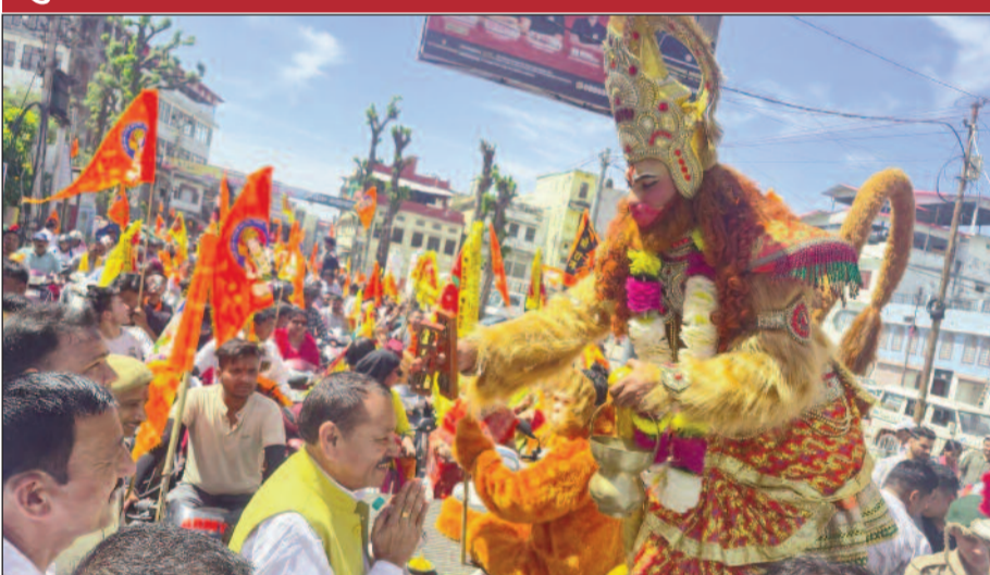
हनुमान जयंती पर कोटद्वार शहर में निकाली गई झांकी

हनुमान जयंती पर श्री सिद्धबली मंदिर समिति की ओर से आयोजित किया गया कार्यक्रम