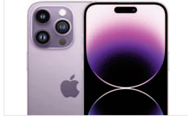
विचार कर रहे हैं कि मॉडल लाने में देरी करें या कम स्पेसिफिकेशन्स वाले फोन पेश करें।

निकट भविष्य में सुधार के कोई संकेत नहीं हैं। शायद चौथी तिमाही या उसके बाद ही ऐसा हो, क्योंकि मेमरी की कमी कम से कम डेढ़ साल तक बनी रहने की आशंका है। आईडीसी इंडिया में एसोसिएट उपाध्यक्ष ने कहा कि डीलरों को भेजी जाने वाली स्मार्टफोन की खेप में तेज गिरावट शायद वैश्विक महामारी के बाद दूसरी ऐसी घटना हो सकती है, जब ज्यादा इनपुट लागत के शुरुआती झटके को वैश्विक पर महसूस किया गया था। उन्होंने कहा कि ब्रांड इस बात पर