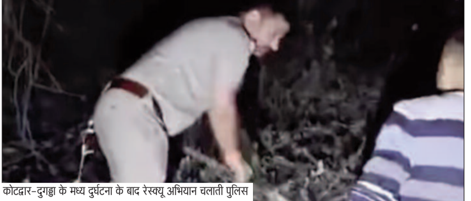
कोटद्वार-दुगड्डा के मध्य दुर्घटना के बाद रेस्क्यू अभियान चलाती पुलिस

जयन्त प्रतिनिधि। कोटद्वार : कोटद्वार-दुगड्डा के मध्य राष्ट्रीय राजमार्ग पर एक कार खाई में गिर गई। दुर्घटना में कार चला रहा व्यक्ति गंभीर रूप से घायल हो गया। घायल व्यक्ति को पुलिस ने उपचार के लिए राजकीय बेस चिकित्सालय कोटद्वार पहुंचाया।