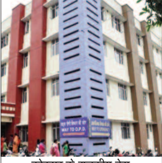
कोटद्वार के राजकीय बेस चिकित्सालय में उमड़ी मरीजों की भीड़

जयन्त प्रतिनिधि। कोटद्वार : गर्मी का प्रकोप लगातार बढ़ता जा रहा है। जिसका असर लोगों के स्वास्थ्य पर भी पड़ने लगा है। पिछले तीन दिन से अस्पताल में उल्टी-दस्त के मरीजों में बढ़ोतरी देखने को मिली है। वहीं, सर्दी-जुकाम व बुखार के मरीजों की संख्या में भी इजाफा हुआ है। चिकित्सक मरीजों को उनके स्वास्थ्य के प्रति सतर्क रहने की सलाह दे रहे हैं। कोटद्वार का तामपान 32 डिग्री सेंटीग्रेड के पार पहुंच गया। लगातार