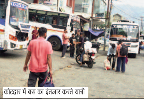
कोटद्वार में बस का इंतजार करते यात्री

जयन्त प्रतिनिधि। कोटद्वार : शादियों के सीजन में पहाड़ व मैदान को जाने वाले यात्रियों की संख्या में इजाफा हो गया है। अचानक बढ़ी यात्रियों की संख्या से परिवहन निगम, गढ़वाल मोटर्स अनारस युनियन (जीएमओयू) व मैक्स वाहनों पर दबाव बढ़ गया है। समय से वाहन नहीं मिलने के कारण यात्रियों को भी परेशानियों का सामना करना पड़ रहा है। ऐसे में सबसे अधिक परेशानी परिवार के साथ सफर करने