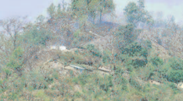
दुगड़ा के क्रेखाल के समीप सुनगर गांव के समीप पहुंची आग से उठता धुंआ

जयन्त प्रतिनिधि। कोटद्वार : दुगड़ा-गमुखाल के मध्य पहाड़ी पर आग लगने से सैकड़ों हेक्टेयर पर फैली वन संपदा जलकर खाक हो गई। जंगल की आग से उठ रहे धुंए के कारण हाईवे पर आवागमन भी चुनौती बन गया है। यही नहीं क्रेखाल के समीप सुनगर गांव तक आग की लपटें पहुंच गईं। ग्रामीणों ने कड़ी मशक्कत के बाद आग पर काबू पाया। वहीं, आग लगने से हाईवे पर पत्थर भी गिर रहे हैं।