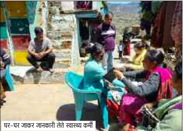
घर-घर जाकर जानकारी लेते स्वास्थ्य कर्मी