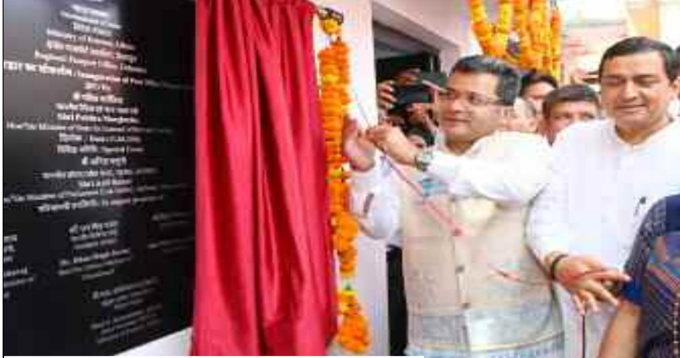
कोटद्वार में पासपोर्ट केंद्र का शुभारंभ करते विदेश राज्य मंत्री पबित्र मार्घेरिता व अन्य

शनिवार को तहसील परिसर में पासपोर्ट केंद्र के शुभारंभ कार्य को संबोधित करते हुए राज्य मंत्री पबित्र मार्घेरिता ने यह बात कही। उन्होंने अपने भाषण की शुरुआत गढ़वाली शब्द देवभूमि का मेरा बै-बन्धों, दीदी- भुल्यो, दाना-सयाणों, आप सबू कैं, म्पर नमस्कार से की। उन्होंने कहा कि हमारा देश विकसित भारत की राह पर तेजी से आगे बढ़ रहा है। हर व्यक्ति तक पासपोर्ट सेवा पहुंचाई जा रही है। पूर्व में लोग पासपोर्ट बनाने के लिए बड़ी- बड़े शहरों के चक्कर काटते थे। लेकिन, अब सरकार हर गांव हर छोटे शहर को पासपोर्ट केंद्र से जोड़ रही है। सांसद अनिल बलूनी ने कहा कि उन्होंने जनता से जितने भी वादे किए