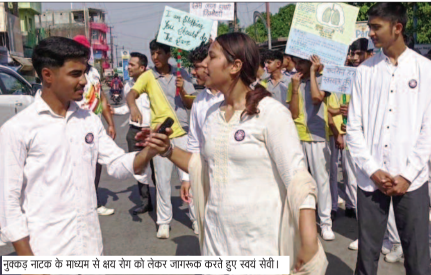
नुक्कड़ नाटक के माध्यम से क्षय रोग को लेकर जागरूक करते हुए स्वयं सेवी।