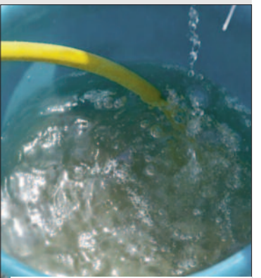
बालासौड़ क्षेत्र में होती गंदे पानी की आपूर्ति

जयन्त प्रतिनिधि। कोटद्वार : नगर निगम क्षेत्र के अंतर्गत बालासौड़ क्षेत्र में गंदे पानी की सप्लाई से लोगों की मुश्किलें बढ़ गई हैं। बीते कई दिनों से इलाके के अधिकांश घरों में दूषित पानी पहुंच रहा है, जिससे लोगों को स्वच्छ पेयजल के लिए परेशानी उठानी पड़ रही है। कई परिवार पाने के लिए बाजार से पानी खरीदने को मजबूर हैं। स्थानीय निवासियों के अनुसार कई बार नलों से आने वाला पानी इतना खराब होता है कि उसका उपयोग दैनिक कार्यों में भी नहीं किया जा सकता। लोगों का कहना है कि क्षेत्र की पुरानी पाइप लाइन जगह-जगह से क्षतिग्रस्त और लीकेज है, जिसके कारण गंदे पानी सप्लाई में मिला रहा है। क्षेत्रवासियों ने बताया कि नई पेयजल लाइन बिछाने की मांग को लेकर कई बार जल संस्थान और जनप्रतिनिधियों को अवगत कराया गया, लेकिन अब तक स्थिति में कोई सुधार नहीं हुआ। दूषित पानी की वजह से बीमारी फैलने का खतरा भी बना हुआ है। लोगों ने विभाग से जल्द उचित कार्रवाई करने की मांग की है।