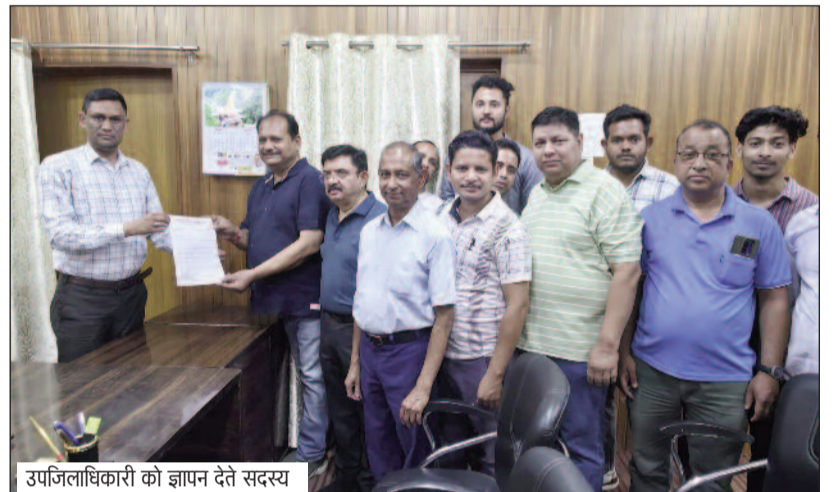
उपजिलाधिकारी को ज्ञापन देते सदस्य

जयन्त प्रतिनिधि। कोटद्वार : अवैध ई-फार्मसी संचालन और बड़े कॉर्पोरेट्स की ओर से अनुचित मूल्य निर्धारण समेत कई प्रमुख मांगों के विरोध में देशभर के 12.40 लाख से अधिक केमिस्ट और वितरक 20 मई को एक दिवसीय राष्ट्रव्यापी दवा व्यापार बंद करेंगे। उत्तरांचल औषधी व्यवसायी महासंघ से संबद्ध कोटद्वार केमिस्ट एसोसिएशन ने मांगों को लेकर शनिवार को एसडीएम को ज्ञापन सौंपा। ऑल इंडिया ऑर्गेनाइजेशन ऑफ केमिस्ट्स एंड ड्रुगिस्ट्स (एआईओसीडी) ने इन मुद्दों को लेकर सरकार से हस्तक्षेप की मांग की है।