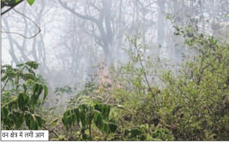
वन क्षेत्र में लगी आग

जयन्त प्रतिनिधि। कोटद्वार : लैसडौन वन प्रभाग के अंतर्गत जंगलों में लगी आग लगातार विकराल रूप लेती जा रही है। तेज गर्मी और सूखे मौसम के कारण आग तेजी से फैल रही है, जिससे आसपास के क्षेत्रों में दहशत का माहौल बना हुआ है। आग अब धीरे-धीरे परिसर और जवहरी गांव के जंगलों तक पहुंचने लगी है। इससे चौड़ा और मिश्रित वन संपदा को नुकसान हो रहा है। ग्रामीणों का कहना है कि पिछले कई दिनों से क्षेत्र में