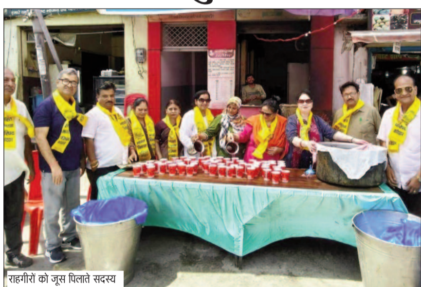
राहगीरों को जूस पिलाते सदस्य