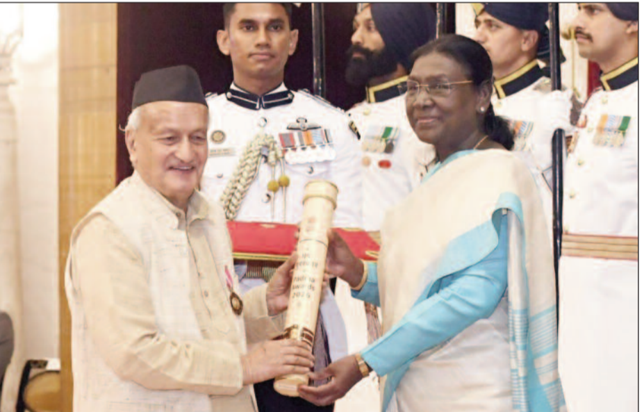
में विशिष्ट सेवा के लिए प्रदान किया जाता है। इन पुरस्कारों की घोषणा हर साल गणतंत्र दिवस के अवसर पर की जाती है। वर्ष 2026 के लिए, राष्ट्रपति ने 131 पद्म पुरस्कार प्रदान करने की मंजूरी दी है। जिनमें

देहरादून। सोमवार को नई दिल्ली में राष्ट्रपति द्रौपदी मुर्मू द्वारा उत्तराखंड के पूर्व मुख्यमंत्री और महाराष्ट्र के पूर्व राज्यपाल भगत सिंह कोशारी को लोक कार्य के लिए पद्मभूषण से सम्मानित किया गया। राष्ट्रपति द्रौपदी मुर्मू ने राष्ट्रपति भवन के गणतंत्र मंडप में आयोजित हुए नागरिक अलंकरण समारोह में वर्ष 2026 के लिए पद्म पुरस्कार प्रदान किए। इस समारोह में भारत के उपराष्ट्रपति सी. पी. राधाकृष्णन, प्रधानमंत्री नरेंद्र मोदी, केंद्रीय गृह मंत्री और सहकारिता मंत्री अमित शाह, केंद्र सरकार के कई अन्य मंत्री और अन्य गणमान्य व्यक्ति भी उपस्थित रहे। पहले नागरिक अलंकरण समारोह में भारत की राष्ट्रपति ने 66 पद्म पुरस्कार प्रदान किए। जिनमें 02 पद्म विभूषण, 06 पद्म भूषण और 58 पद्म शामिल हैं।