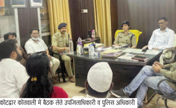
कोटद्वार कोतवाली में बैठक करते उपजिलाधिकारी व पुलिस अधिकारी

जयन्त प्रतिनिधि। कोटद्वार : आगामी ईद पर्व को देखते हुए कोटद्वार पुलिस एवं प्रशासन पूरी तरह सतर्क है। शहर में शांति, कानून-व्यवस्था और सामाजिक सौहार्द बनाए रखने के उद्देश्य से पुलिस गश्त बढ़ा दी गई है तथा संवेदनशील क्षेत्रों में विशेष निगरानी की व्यवस्था की गई है।