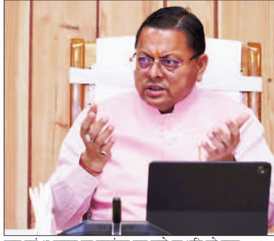
जयन्त प्रतिनिधि। देहरादून : मुख्यमंत्री पुष्कर सिंह धामी ने सोमवार को निजी आवास, खटीमा से समस्त जिलाधिकारियों के साथ वर्चुअल बैठक की। इस दौरान मुख्यमंत्री ने सभी जिला अधिकारियों को सरकारी भूमि से अतिक्रमण हटाने के अभियान में तेजी लाने के निर्देश दिए। मुख्यमंत्री ने कहा कि ग्राम सभाओं में स्थित सरकारी भूमि की भी जांच की जाए। मुख्यमंत्री ने संदिग्ध गतिविधियों पर प्रभावित निगमों से वरिष्ठ अधिकारियों को सलाह दी कि वे जमीन के भी निर्देश दिए। मुख्यमंत्री ने कहा कि मानसून से पहले आपदा की दृष्टि से संवेदनशील क्षेत्रों में विशेष सतर्कता एवं निगरानी बढ़ाई जाए। मुख्यमंत्री ने कहा कि राज्य में भू कानून का उल्लंघन कर खरीदी गई जमीनों की जांच भी की जाए। कहा कि इस अभियान में तेजी लाते हुए त्वरित सुनवाई की

उम्मीद पोर्टल पर दर्ज वक्फ संपत्तियों के ब्योरे की भी नियमित जांच हो - मुख्यमंत्री ने समस्त जिलाधिकारियों के साथ की वर्चुअल बैठक