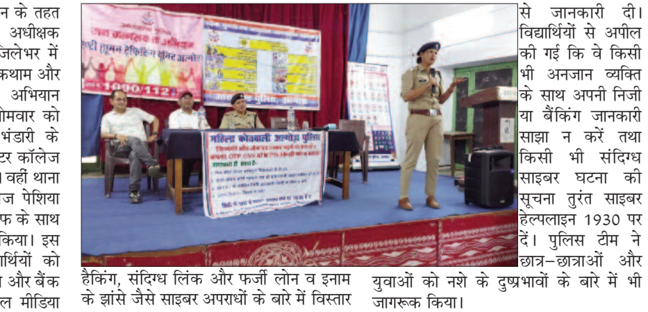
हैकिंग, संदिग्ध लिंक और फर्जी लोन व इनाम युवाओं को नशे के दुष्प्रभावों के बारे में भी जागरूक किया।