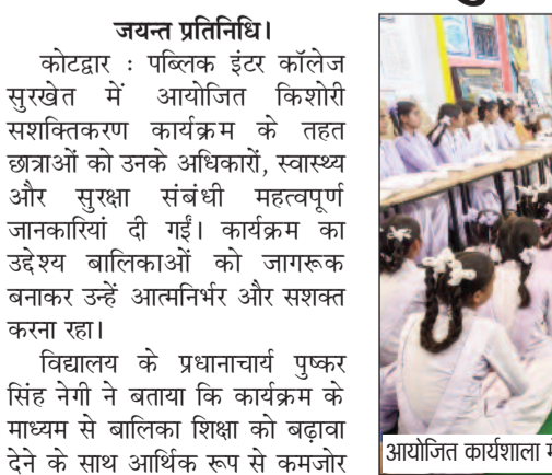
आयोजित कार्यशाला में भाग लेते विद्यार्थी

संबंधी जानकारी देकर सैनेटरी पैड भी वितरित किए गए। कार्यक्रम में एनोमिया से बचाव के लिए पोषण के प्रति जागरूक किया गया और मासिक धर्म के दौरान स्वच्छता बनाए रखने