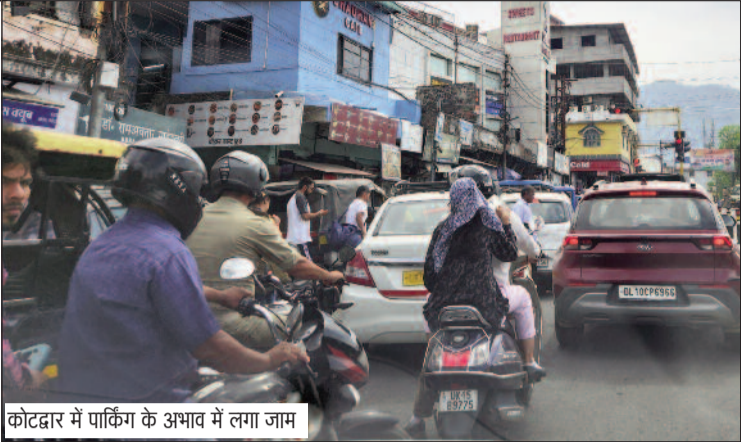
कोटद्वार में पार्किंग के अभाव में लगा जाम

शहर में लगातार वाहनों की संख्या बढ़ती जा रही है। ऐसे में पार्किंग स्थल नहीं होने से यातायात व्यवस्था बेपटरी होती जा रही है। राष्ट्रीय राजमार्ग के साथ ही अन्य मार्गों पर