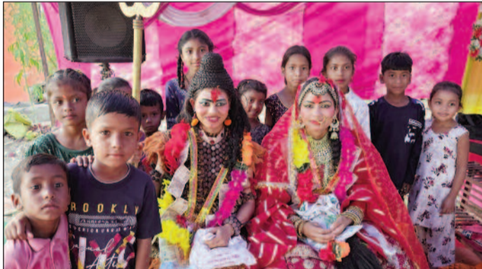
आयोजित कथा के दौरान निकली गई शिव-पार्वती की झांकी