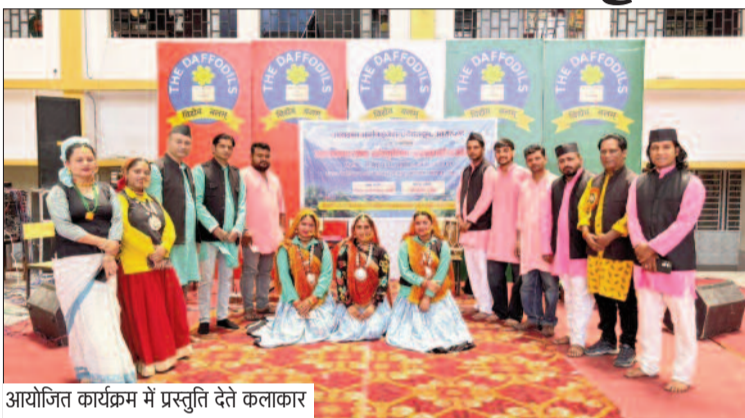
आयोजित कार्यक्रम में प्रस्तुति देते कलाकार

जयन्त प्रतिनिधि। कोटद्वार : एलायंस ऑर्गेनाइजेशन की ओर से डेफोडिल्स पब्लिक इंटर कॉलेज में उत्तराखंड लोक सांस्कृतिक उत्सव एवं कार्यक्रमों का भव्य आयोजन किया गया। कार्यक्रम में लोक