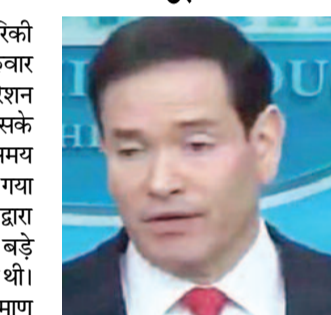
को शुरू हुआ और खाड़ी क्षेत्र और व्यापक मध्य पूर्व को तीव्र अस्थिरता और संघर्ष के दौर में धकेल दिया। ऑपरेशन की समाप्ति की घोषणा करते हुए रूबियो ने कहा कि ऑपरेशन एपिक फ्यूरी समाप्त हो गया है। हमने इस अभियान के उद्देश्यों को प्राप्त कर लिया है। हम ऐसी किसी और स्थिति की कामना नहीं करते। हम शांति का मार्ग अपनाना चाहेंगे। ट्रंप एक समझौते को प्राथमिकता देंगे... जो कि अब

वॉशिंगटन, एजेंसी। अमेरिकी विदेश मंत्री मार्को रूबियो ने गुरुवार तड़के घोषणा की कि ऑपरेशन एपिक फ्यूरी समाप्त हो गया है। इसके साथ ही दो महीने से अधिक समय से चल रही अशांति का अंत हो गया है, जो अमेरिका और इजराइल द्वारा ईरान के खिलाफ किए गए एक बड़े सैन्य संघर्ष के कारण उत्पन्न हुई थी। अली खामेनेई की परमाणु महत्वकांक्षाओं को रोकने के उद्देश्य से शुरू हुए इस संघर्ष ने तेहरान में भी भारी राजनीतिक उथल-पुथल मचा दी थी। खामेनेई की हत्या के बाद, उनके बेटे मौजतबा खामेनेई को नया सर्वोच्च नेता नियुक्त किया गया, जो सत्ता में एक महत्वपूर्ण परिवर्तन का प्रतीक था। अमेरिकी राष्ट्रपति डोनाल्ड ट्रंप के नेतृत्व में इजराइल की साझेदारी में शुरू किया गया व्यापक सैन्य अभियान, ऑपरेशन एपिक फ्यूरी, 28 फरवरी को शुरू हुआ और खाड़ी क्षेत्र और व्यापक मध्य पूर्व को तीव्र अस्थिरता और संघर्ष के दौर में धकेल दिया। ऑपरेशन की समाप्ति की घोषणा करते हुए रूबियो ने कहा कि ऑपरेशन एपिक फ्यूरी समाप्त हो गया है। हमने इस अभियान के उद्देश्यों को प्राप्त कर लिया है। हम ऐसी किसी और स्थिति की कामना नहीं करते। हम शांति का मार्ग अपनाना चाहेंगे। ट्रंप एक समझौते को प्राथमिकता देंगे... जो कि अब