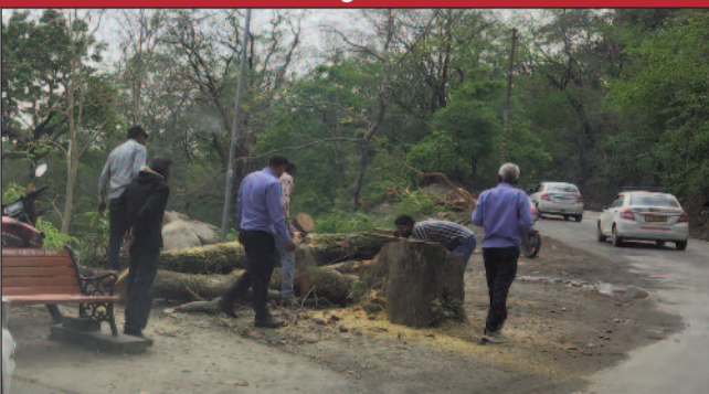
कोटद्वार के सनेह क्षेत्र से प्रस्तावित राष्ट्रीय राजमार्ग के बाईपास के लिए तिलवादांग वन विश्राम के समीप काटे पेड़

कोटद्वार नगर में राष्ट्रीय राजमार्ग वर्तमान में नगर के मध्य से गुजर रहा है। अतिक्रमण के चलते राजमार्ग काफी संकरा हो गया है। इस कारण राष्ट्रीय राजमार्ग विभाग ने राजमार्ग को नगर के बाहर से निकालने की योजना बनाई। इसके लिए कौड़िया से सनेह क्षेत्र होते हुए राजमार्ग को सिद्धबली मंदिर से पहले मौजूदा राजमार्ग से जोड़ा जाना है। कौड़िया से राष्ट्रीय राजमार्ग काशीरामपुर तल्ला, नाथपुर, विशानपुर, जीतपुर, रतनपुर, ग्रास्टनगंज, कोटद्वार गांव होते हुए वन विभाग के तिलवादांग वन विश्राम गृह के समीप से मौजूदा सड़क पर जाकर मिलेगा। राष्ट्रीय राजमार्ग के बाईपास