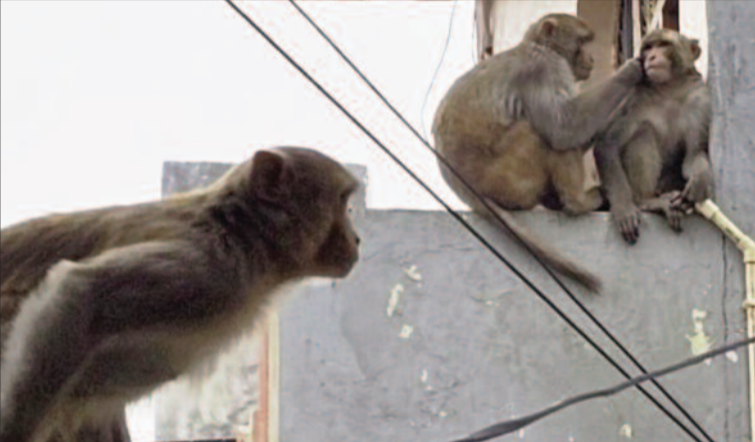
कोटद्वार शहर में घूमते बंदर

कोटद्वार नगर निगम क्षेत्र में शायद ही कोई ऐसा बाड़ हो जहां उल्टाई बंदर के झुंड न दिखाई दें। हालात यह हैं कि दिन हो अथवा रात, बंदरों का शोर हर वक्त सुनाई देता है। बंदरों के कारण वार्डवासियों का अपने घरों की छत पर कपड़े व अनाज सुखाना भी मुश्किल हो गया है। संपन्न लोगों ने छत को टिन शेड व जालियों से कवर कर दिया है, ताकि बंदर नुकसान न कर पाए। बंदरों के डर से बच्चों ने घर के बाहर खेलना भी छोड़ दिया