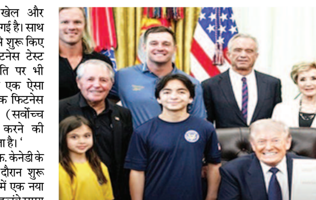
रॉबर्ट एफ. केनेडी जूनियर ने कहा, 'अब हम दुनिया के सबसे ज्यादा बीमार देशों में से एक बन गए हैं। हमारे बच्चों में मोटापे का स्तर 5 प्रतिशत से बढ़कर 20 प्रतिशत तक पहुंच गया है। 70 प्रतिशत वयस्क मोटे या ज्यादा वजन वाले हैं और 77 प्रतिशत आधुनिक

वाशिंगटन, एजेंसी। अमेरिका के राष्ट्रपति डोनाल्ड ट्रंप ने एक पुराने प्रेसिडेंशियल फिटनेस टेस्ट कार्यक्रम को फिर से शुरू करने की घोषणा की है। यह कार्यक्रम पहले अमेरिकी स्कूलों में बच्चों की शारीरिक फिटनेस जांचने के लिए बरकाया जाता था, लेकिन बराक ओबामा सरकार के दौरान इसे बंद कर दिया गया था। व्हाइट हाउस में आयोजित एक कार्यक्रम में ट्रंप ने खेलाडियों, अधिकारियों और बच्चों के साथ मिलकर युवाओं में फिटनेस और खेल भावना को बढ़ावा देने की बात कही। इस कार्यक्रम में मशहूद गॉल्फ ब्रायसन ड्रीचैम्ब्यू, गोल्फर गैरी प्लेयर और पूर्व एनएचएल खिलाड़ी टी. जे. ओशी जैसे पेशेवर एथलीट भी शामिल हुए। ट्रंप ने कहा, 'आज मैंने एक घोषणापत्र पर हस्ताक्षर किए हैं, जिसमें राष्ट्रीय युवा खेल और फिटनेस को मान्यता दी गई है। साथ ही, मैंने नए और फिर से शुरू किए गए 'प्रेसिडेंशियल फिटनेस टेस्ट अवार्ड' की पहली प्रति पर भी हस्ताक्षर किए हैं। यह एक ऐसा प्रमाणपत्र है जो शारीरिक फिटनेस के 'गोल्ड स्टैंडर्ड' (सर्वोच्च मानक) को हासिल करने की उपलब्धि को मान्यता देता है। यह कार्यक्रम जॉन एफ. केनेडी के राष्ट्रपति कार्यकाल के दौरान शुरू किया गया था। 2013 में एक नया कार्यक्रम आने से पहले यह लंबे समय तक अमेरिकी स्कूलों का एक अहम हिस्सा रहा था। ट्रंप ने अपने भाषण में खेल प्रतियोगिता और अनुशासन पर जोर दिया। उन्होंने कहा कि प्रतिस्पर्धी अमेरिका की पहचान है और देश को एक बनाए रखने के लिए जरूरी है। स्वास्थ्य और मानव सेवा सचिव