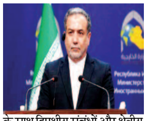
के साथ द्विपक्षीय संबंधों और क्षेत्रीय व वैश्विक मुद्दों पर चर्चा करेंगे। चीन से पहले तीन देशों का किया दौरा: कुछ दिनों पहले ही उन्होंने पाकिस्तान, ओमान और रूस का दौरा किया है। ये दौर पश्चिम एशिया में जारी संकट के बीच बातचीत का हिस्सा है। पिछले महीने रूस दौर के दौरान अराघची ने राष्ट्रपति व्लादिमीर पुतिन से मुलाकात की थी। पुतिन ने कहा था कि रूस पश्चिम एशिया में शांति स्थापित करने के लिए हरसंभव प्रयास करेगा। उन्होंने यह भी कहा कि ईरान के लोग अपनी संप्रभुता के लिए बहादुरी से लड़ रहे हैं। इस मुलाकात में अराघची ने अमेरिका और इजराइल से संघर्ष और हमलों पर भी विस्तार से चर्चा की। पुतिन ने कहा कि रूस ईरान के हितों का समर्थन करेगा और क्षेत्र में शांति बहाल करने में मदद करेगा। पाकिस्तान दौर के दौरान अराघची ने ईरान और अमेरिका के बीच बातचीत की संभावनाओं पर भी चर्चा की। इसके बाद ओमान की यात्रा में उन्होंने समुद्री सुरक्षा पर फोकस दिया। वहां होमजुज जलडमरूमध्य को लेकर चर्चा हुई, जो एक अहम समुद्री मार्ग है। अराघची ने कहा कि ईरान और ओमान दोनों इस जलडमरूमध्य के तटीय देश हैं।

बीजिंग, एजेंसी। चीन के विदेश मंत्री वांग यी ने बुधवार को बीजिंग में अपने ईरानी समकक्ष अब्बास अराघची से मुलाकात की। चीनी सरकारी समाचार एजेंसी शिन्हुआ ने इस बैठक की जानकारी दी। हालांकि, इसमें अधिक विवरण साझा नहीं किया गया। अराघची की यह पहली चीन यात्रा ऐसे समय में हो रही है, जब पश्चिम एशिया में तनाव जारी है। इस बीच, अमेरिका के विदेश मंत्री मार्को रूबियो ने उम्मीद जताई कि चीन इस यात्रा के दौरान ईरान से होमजुज जलडमरूमध्य पर अपना नियंत्रण कम करने की बात करेगा और क्षेत्र में तनाव घटाने की दिशा में संदेश देगा। इससे पहले ईरान के सरकारी प्रसाक आईआरआईबी ने जानकारी दी थी कि इस दौर के दौरान अराघची अपने चीनी समकक्ष के साथ द्विपक्षीय संबंधों और पश्चिम एशिया में जारी संकट समेत क्षेत्रीय और अंतरराष्ट्रीय मुद्दों पर चर्चा करेंगे।