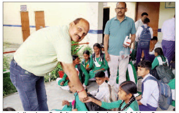
राईकों जयदेवपुर सिगढ़ी में छात्रों को एल्बेडाजोल की गोली देते हुए शिक्षक।