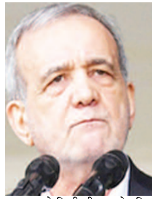
असुरक्षा को किसी भी तरह से उचित विकल्प नहीं मानता। इसके साथ ही, पेजेशकियान ने कहा कि ईरान को परमाणु तकनीक से वंचित नहीं किया जाना चाहिए। उन्होंने कहा, 'अमेरिका ऐसे व्यवहार कर रहा है जैसे ईरान को परमाणु उद्योग रखने का अधिकार ही

तेहरान, एजेंसी। ईरान के राष्ट्रपति मसूद पेजेशकियान ने इराक के प्रधानमंत्री-नामित अली अल-जैदी के साथ फोन पर बातचीत की। इस दौरान पेजेशकियान ने कहा कि ईरान अंतरराष्ट्रीय कानून के दायरे में बातचीत के लिए तैयार है, लेकिन वह किसी भी दबाव के आगे झुकेंगा नहीं। समाचार एजेंसी शिन्हुआ के अनुसार, एक आधिकारिक बयान में राष्ट्रपति पेजेशकियान ने कहा, 'हमारी समस्या यह है कि एक ओर अमेरिका देश पर दबाव की नीति अपना रहा है और दूसरी ओर वह चाहता है कि ईरान बातचीत की मेज पर आए और आखिरकार उसकी एकतरफा मांगों के सामने आत्मसमर्पण कर दे। लेकिन यह असंभव है।' उन्होंने कहा कि ईरान मूल रूप से युद्ध और