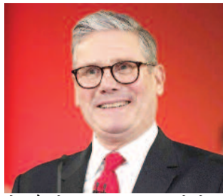
होना है, लेकिन अगर गुरुवार को लेबर पार्टी बुरी तरह हारती है, तो स्टार्मर के खिलाफ उनकी अमेरिकी ही पार्टी में एक बड़ी बगावत शुरू हो सकती है। एक विशेषज्ञ के अनुसार, भारी जीत के दो साल के अंदर ही स्टार्मर अब लोगों की निराशा का बहुत बड़ा कारण बन गए हैं।

लंदन, एजेंसी। ब्रिटेन में इस वक्त राजनीतिक घमासान मचा हुआ है। गुरुवार को होने वाले स्थानीय चुनाव ब्रिटेन के मौजूदा प्रधानमंत्री कीर स्टार्मर के लिए बहुत बड़ी मुसीबत बन गए हैं। इन चुनावों के नतीजे यह तय कर सकते हैं कि स्टार्मर अपनी कुर्सी पर बने रहेंगे या उन्हें अपना पद छोड़ना पड़ेगा। यह चुनाव साबित कर देंगे कि अब ब्रिटेन एक बंटी हुई राजनीति के दौर में प्रवेश कर चुका है। माना जा रहा है कि देश की जनता प्रधानमंत्री से काफी निराश है और इसका सीधा असर चुनाव की वोटिंग में देखने को मिलेगा। ब्रिटेन की राजनीति अब कई अलग-अलग राजनीतियों में बंटती हुई जान आ रही है, जिससे सत्ताधारी पार्टी की मुश्किलें और भी ज्यादा बढ़ गई हैं।