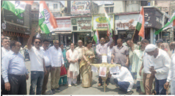
कोटद्वार के झंडा चौक पर मुख्यमंत्री का पुतला दहन करते के लिए एकत्र हुए कांग्रेसजन

जयन्त प्रतिनिधि। कोटद्वार : प्रदेश में लगातार बिगड़ रही कानून व्यवस्था व महिलाओं पर बढ़ रहे अत्याचार पर कांग्रेस ने रोष व्यक्त किया है। कहा कि प्रदेश की भाजपा सरकार व्यवस्था सुधारने में पूरी तरह नाकाम साबित हो रही है। इस दौरान कांग्रेस ने मुख्यमंत्री का भी पुतला दहन किया। शुरुवार को कांग्रेस कार्यकर्ता व पदाधिकारी प्रदेश सरकार के खिलाफ नारेबाजी करते हुए झंडाचौक के समीप एकत्रित हुए। यहां उन्होंने प्रदेश सरकार का पुतला दहन किया। कहा कि प्रदेश में कानून व्यवस्था पूरी तरह बेपटरी हो चुकी है। आदि दिन महिलाओं पर अत्याचार की घटनाएं सामने आ रही हैं। वक्ताओं ने कहा कि चंपावत की घटना ने पूरे प्रदेश को झकझोर कर रख दिया है। मांग की गई कि मामले की निष्पक्ष व त्वरित जांच कर दोषियों के खिलाफ कठोर कार्रवाई की जाए। कहा कि महिलाओं की सुरक्षा व न्याय के मुद्दे पर सरकार को संवेदनशील व जवाबदेह