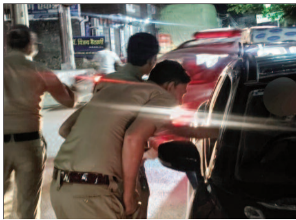
शराब के नशे में वाहन चलाने वालों के खिलाफ अभियान चलाती पुलिस