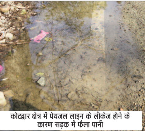
कोटद्वार क्षेत्र में पेयजल लाइन के लीकेज होने के कारण सड़क में फैला पानी