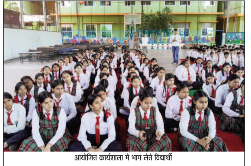
आयोजित कार्यशाला में भाग लेते विद्यार्थी