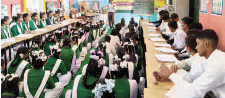
आयोजित कार्यशाला में भाग लेते विद्यार्थी

जयन्त प्रतिनिधि। कोटद्वार : पब्लिक इंटर कॉलेज सुरखेत में विश्व रेडक्रॉस दिवस पर कार्यशाला आयोजित कर रेडक्रॉस सोसायटी के