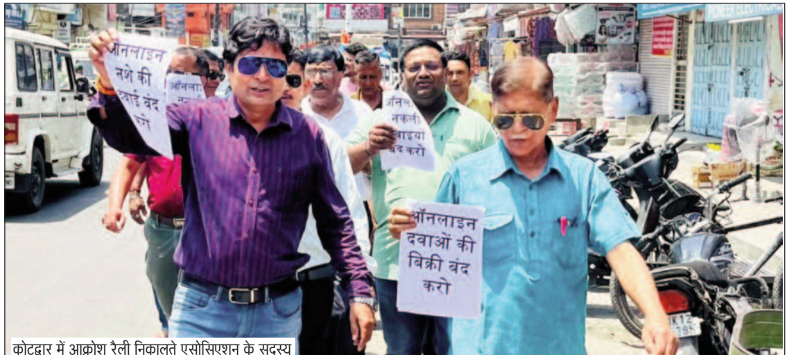
कोटद्वार में आक्रोश रैली निकालते एसोसिएशन के सदस्य

जयन्त प्रतिनिधि। कोटद्वार : अवैध ऑनलाइन दवा बिक्री के विरोध में कैमिस्ट एसोसिएशन ने बुधवार को अपने सभी प्रतिष्ठान बंद रखकर जोरदार प्रदर्शन किया। इस दौरान दवा व्यापारियों ने जुलूस निकालकर तहसील परिसर तक पहुंचकर ऑनलाइन दवा बिक्री पर रोक लगाने की मांग उठाई। देशव्यापी बंद के समर्थन में झंडाचौक से तहसील तक नारेबाजी करते हुए जुलूस निकाल प्रदर्शन किया गया। प्रदर्शनकारियों ने जनस्वास्थ्य पर उत्पन्न गंभीर खतरे को देखते हुए केंद्र सरकार से दवाइयों की अवैध ऑनलाइन बिक्री पर रोक लगाते हुए कैमिस्टों को संरक्षण देने की मांग की। कहा कि बिना किसी स्पष्ट वैधानिक प्रावधान के ऑनलाइन माध्यम से दवाइयों की बिक्री, फर्जी ई प्रिस्क्रिप्शन, बिना वैध चिकित्सकीय परामर्श के घर-घर दवा वितरण और अत्यधिक छूट