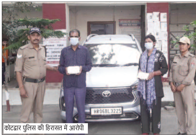
कोटद्वार पुलिस की हिरासत में आरोपी

घटना उस समय हुई जब घमंडपुर निवासी एक महिला लालबत्ती चौक से अंटो में बैठकर घर लौट रही थी। अंटो में मौजूद कुछ महिलाओं ने सफर के दौरान उससे बातचीत शुरू कर दी और मौका मिलते ही उसके गले से करीब एक तोले की सोने की चेन पर कर दी। महिला को चोरी की जानकारी तब हुई, जब वह अपने गंतव्य पर पहुंची। शिकायत मिलने के बाद पुलिस ने मामला दर्ज कर जांच शुरू की। जांच के दौरान पुलिस ने शहर और आसपास लगे सीसीटीवी कैमरों की फुटेज खंगाली, जिसमें एक