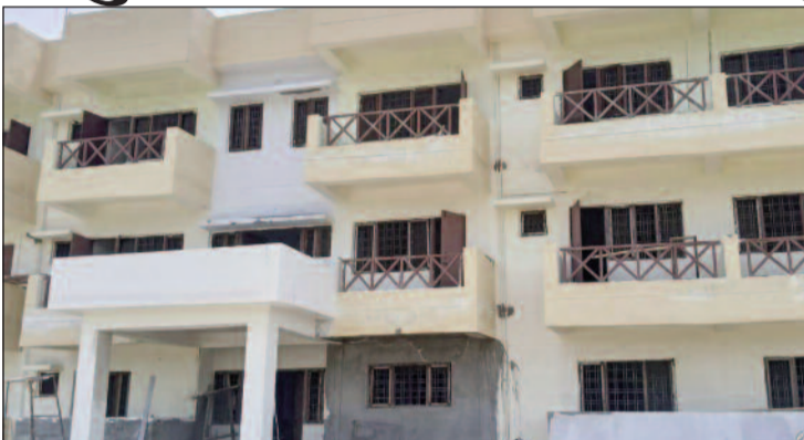
भार क्षेत्र में बनाया जा रहा आधुनिक वर्किंग वूमन हॉस्टल का भवन