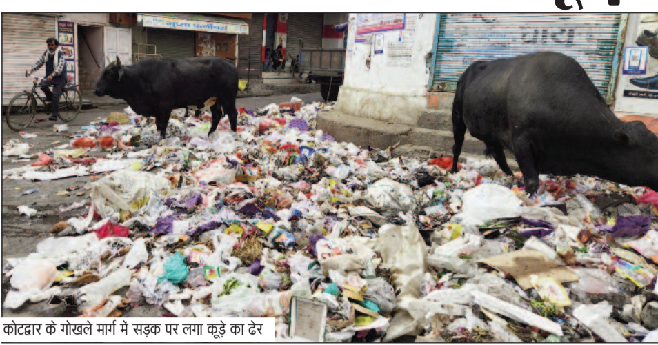
कोटद्वार के गोखले मार्ग में सड़क पर लगा कूड़े का ढेर

जयन्त प्रतिनिधि। कोटद्वार: शहर को स्वच्छ व सुंदर बनाने के लिए नगर निगम लगातार अभियान चला रहा है। बावजूद कुछ लोग निगम की इस मुहिम पर पेलती लगा रहे हैं। ऐसे में अब नगर निगम ने ऐसे लोगों के खिलाफ सख्ती दिखा शुरू कर दिया है। सार्वजनिक स्थान पर कूड़ा फेंकने व जलाने वालों के खिलाफ एक घंटे के भीतर आर्थिक दंड की कार्रवाई की जाएगी। यही नहीं, यदि कोई व्यक्ति सार्वजनिक स्थान पर कूड़ा डालने वालों की शिकायत आनलाइन देता है तो उसकी पहचान गुप्त रखी जाएगी।