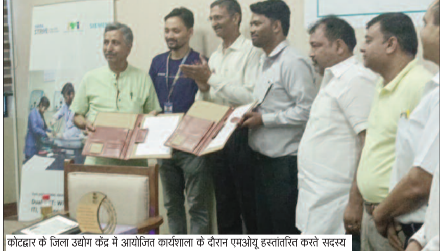
कोटद्वार के जिला उद्योग केंद्र में आयोजित कार्यशाला के दौरान एमओयू हस्तांतरित करते सदस्य

जयन्त प्रतिनिधि। कोटद्वार: आईटीआई प्रशिक्षुओं व स्थानीय उद्योगों के बीच बेहतर समन्वय स्थापित करने व कौशल आधारित रोजगार के अवसरों को बढ़ाने के लिए जिला उद्योग केंद्र की ओर से कार्यशाला आयोजित की गई। कार्यशाला में आईटीआई व उद्योग के बीच समन्वय बढ़ाया गया। सीमेंस, टाट स्ट्राइव, आईटीआई व जिला उद्योग केंद्र, कोटद्वार के संयुक्त तत्वावधान में आयोजित कार्यशाला में आईटीआई व विभिन्न उद्योगों के मध्य आठ एमओयू हस्तांतरित किए गए। कार्यक्रम में 25 से अधिक उद्योगों व आईटीआई के 40 से अधिक प्रशिक्षुओं ने सहभागिता करते हुए 11 नवाचार आधारित प्रोजेक्ट्स प्रदर्शित किए। इनमें से कई प्रोजेक्ट्स को उद्योगों के लिए उपयोगी एवं व्यवहारिक माना गया। कार्यशाला में स्थानीय उद्योगों, आईटीआई प्रतिनिधियों, प्रशिक्षकों व प्रशिक्षुओं की स्रिस्र भागीदारी देखने को मिली। प्रतिभागियों ने इस पहल को कौशल शिक्षा और उद्योगों के बीच मजबूत साझेदारी की दिशा में प्रभावी कदम बताया। कार्यक्रम में 110 से अधिक