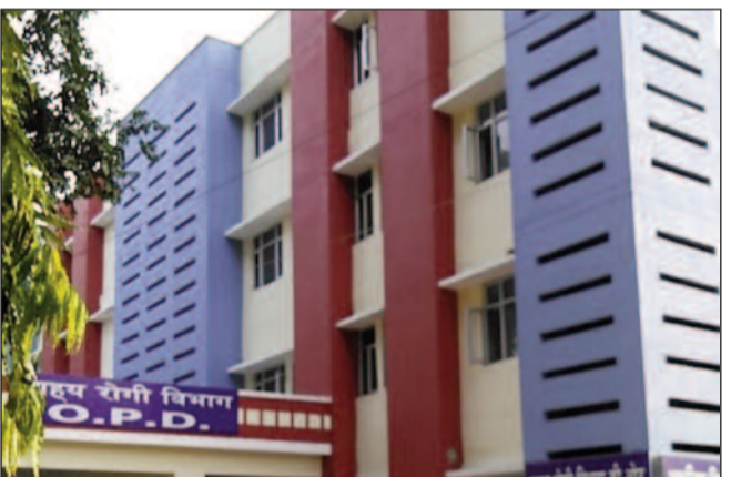
कोटद्वार बेस अस्पताल जहां एक्सरा मशीन खराब है।

राजकीय बेस चिकित्सालय में प्रतिदिन पैदान के साथ ही पहाड़ से सैकड़ों मरीज उपचार के लिए पहुंचते हैं। लेकिन, पिछले दस दिन से मरीजों को अस्पताल में एक्सरे की सुविधा नहीं मिल पा रही है। दरसअल, दस दिन पहले एक्सरे मशीन के साफ्टवेयर में तकनीकी खराबी आ गई थी। जिसके कारण एक्सरे मशीन ने काम करना बंद कर