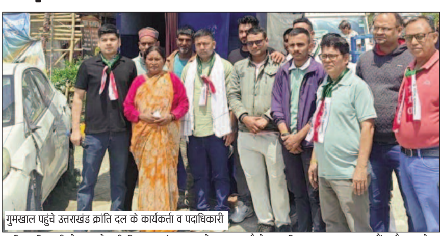
गुमखाल पहुंचे उत्तरखंड क्रांति दल के कार्यकर्ता व पदाधिकारी