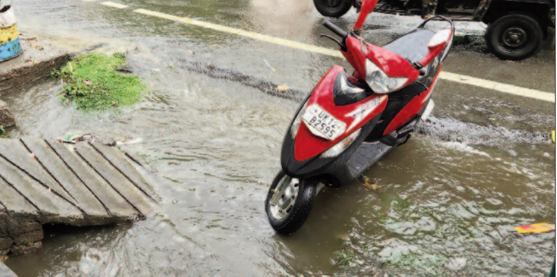
कोटद्वार में बारिश के दौरान सड़क पर बहता पानी

जयन्त प्रतिनिधि। कोटद्वार: पिछले कई दिनों से गर्मी का प्रकोप झेल रहे शहरवासियों को रिविंवार को हुई बारिश से काफी राहत मिली। बारिश के बाद मौसम सुहावना हो गया। लोगों ने घरों से बाहर निकलकर मौसम का आनंद लिया। रिविंवार सुबह से ही आसमान में बादल छाये हुए थे। करीब 11 बजे कोटद्वार में बारिश बदला और छमाछम बारिश होने लगी। बारिश से लोगों को काफी राहत मिली। वहीं, बारिश के दौरान तेज हवा चलने से बद्रीनाथ मार्ग पर स्थित सीतापुर नेत्र चिकित्सालय परिसर में स्थित कनर का पेड़ टूट गया। साथ ही चिकित्सालय के छत पर बनी टीन शेड भी उखड़ कर दूर जा