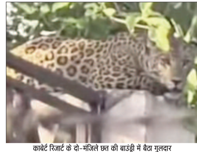
कार्बेट रिजार्ट के दो-मंजिले छत की बाउंड्री में बैठा गुलदार

वर्ष 2015 में 14 करोड़ की लागत से जीएमवीएन की ओर से कार्बेट रिजार्ट का निर्माण करवाया गया था। लेकिन, उद्घाटन के बाद से यह रिजार्ट बंद पड़ा हुआ है। ऐसे में