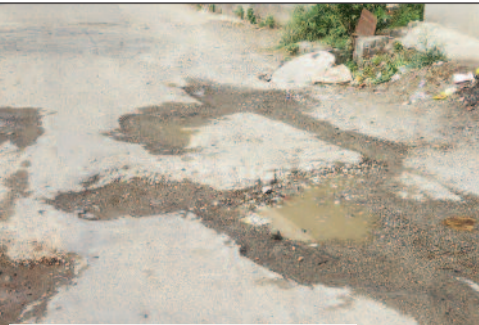
कोटद्वार नगर निगम क्षेत्र में बदहाल पड़ी सड़कें

जयन्त प्रतिनिधि। कोटद्वार : भले ही नगर निगम बेहतर विकास के दावे कर रहा हो। लेकिन, हकीकत यह है कि नगर निगम बदहाल सड़कों की मरम्मत तक नहीं करवा पा रहा है। नतीजा, बदहाल सड़कों पर दुर्घटनाओं का खतरा बना हुआ है। आए दिन दोपहिया वाहन चालक गड्ढों की चपेट में आने से चोटिल हो रहे हैं। सड़क मरम्मत के लिए कई बार क्षेत्रवासी नगर निगम से गुहार लगा चुके हैं। लेकिन, अब तक इस ओर गंभीरता से ध्यान नहीं दिया गया। एक से चालीस वार्ड तक शायद ही कोई ऐसी सड़क हो जहां गड्ढे न दिखाई दें। गड्ढों के बीच खो रही सड़कें न राहगीरों की चुनौती बढ़ा दी है। कई स्थानों पर गड्ढे इतने बड़े हैं कि