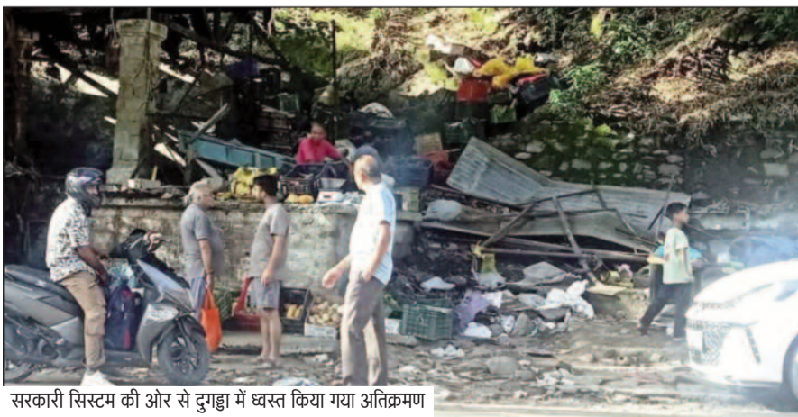
सरकारी सिस्टम की ओर से दुगड़ा में ध्वस्त किया गया अतिक्रमण

जयन्त प्रतिनिधि। कोटद्वार : दुगड़ा में नगर पालिका व प्रशासन की ओर से अतिक्रमण के खिलाफ अभियान चलाया गया। इस दौरान हाईवे पर पक्की दुकानों पर बुलडोजर चलाया गया। प्रशासन व नगर पालिका ने दुकानदारों को दोबारा अतिक्रमण न करने की सख्त चेतावनी दी। प्रशासन और नगर पालिका की संयुक्त टीम ने सड़क किनारे रखे सामान को हटवाया तथा कई स्थानों पर अतिक्रमण कर रहे सामान को जल भी किया। अभियान की सूचना मिलते ही कई रेहड़ी-ठेली संचालक अपना सामान समेटकर आसपास की गलियों की ओर भागते नजर आए। अधिकारियों