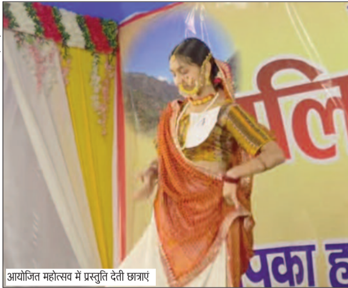
आयोजित महोत्सव में प्रस्तुति देती छात्राएं

कोटद्वार : नगर निगम क्षेत्र के मोटाढाक मिनी स्टेडियम में बुधवार से छह दिवसीय मालिनी महोत्सव का भव्य शुभारंभ हो गया। उद्घाटन अवसर पर स्थानीय कलाकारों ने रंगारंग सांस्कृतिक प्रस्तुतियां देकर दर्शकों का मन मोह लिया। वहीं महिलाओं के लिए आयोजित सुई-धागा प्रतियोगिता आकर्षण का केंद्र रही।