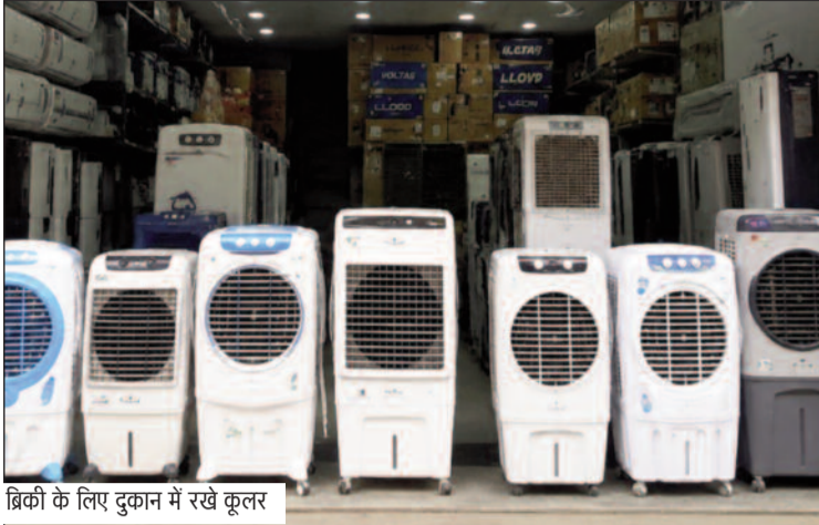
बिचकी के लिए दुकान में रखे कूलर

जयन्त प्रतिनिधि। कोटद्वार : भीषण गर्मी आमजन को परेशान कर रही है। ऐसे में लोग गर्मी से निजात के लिए घरों में एसी व कूलर लगा रहे हैं। यही कारण है कि इन दिनों बाजार में कूलर व एसी की डिमांड तेजी से बढ़ गई है। गत वर्ष के मुकाबले इस वर्ष इस डिमांड में चालीस प्रतिशत ग्रोथ देखने को