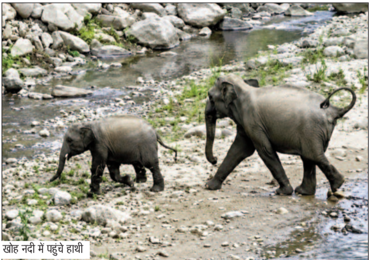
खोह नदी में पहुंचे हाथी

जयन्त प्रतिनिधि। कोटद्वार : भीषण गर्मी से राहत पाने के लिए खोह नदी में नहाने पहुंच रहे लोगों के