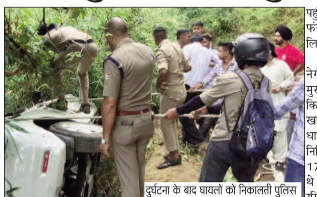
दुर्घटना के बाद घायलों को निकालती पुलिस

जयन्त प्रतिनिधि। कोटद्वार : कोटद्वार-पुलंडा मार्ग पर सोमवार को एक रिवफ्ट कार दुर्घटनाग्रस्त होकर सड़क से नीचे खाई की ओर पेड़ पर अटक गई। सूचना मिलते ही पुलिस मौके पर