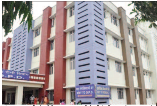
कोटद्वार का राजकीय बेस चिकित्सालय जहां इन दिनों मरीजों की संख्या में इजाफा हुआ है।

हनुमाने वाले पांच-छः सौ मरीजों में से सौ-डेढ़ सौ मरीज उल्टी-दस्त से पीड़ित हैं। चिकित्सक भी मरीज व उनके तीमारदारों को धूप व लू से बचने की सलाह दे रहे हैं। वहीं, क्षेत्र के निजी अस्पतालों में भी मरीजों की संख्या में इजाफा देखने को मिल रहा है। गढ़वाल के प्रवेश द्वार कोटद्वार में लगातार गर्मी का प्रकोप बढ़ता जा रहा है। पिछले चार दिन से तापमान 38 से 40 डिग्री सेंटीग्रेड के पार पहुंच रहा है। ऐसे में शरीर को झुलसाने वाली धूप व लू के थपड़े आमजन की सेहत को बिगाड़ने लगे हैं। सुबह से अस्पताल में ओपीडी की पंजी बनवाने वालों की लंबी-लंबी लाइनें नजर आ रही हैं। अस्पताल में अधिकांश मरीज उल्टी-दस्त, डायरिया व बुखार के पहुंच रहे हैं। बेस