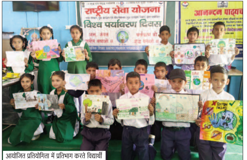
आयोजित प्रतियोगिता में प्रतिभाग करते विद्यार्थी