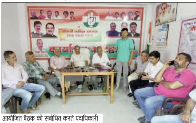
आयोजित बैठक को संबोधित करते पदाधिकारी

जनता प्रतिनिधि। कोटद्वार : राहुल गांधी के उत्तरखंड दौरे के दौरान सभाओं में उमड़ी भारी भीड़ पर कांग्रेसियों ने खुशी व्यक्त की है। कहा कि भले ही राहुल गांधी सभा स्थल तक नहीं पहुंच पाए। लेकिन, उन्होंने वीडियो संबोधन से कार्यकर्ताओं को नई दिशा दी है। बदरीनाथ मार्ग स्थित कांग्रेस कार्यालय में बैठक का आयोजन किया गया। इस अवसर पर पूर्व