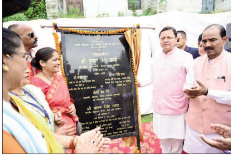
आधारित पर्यटन के क्षेत्र में भी व्यापक कार्य किए जा रहे हैं। उन्होंने कहा कि हवन डिस्ट्रिक्ट, वन फेस्टिवलहक की अवधारणा के तहत मेलों और स्थानीय सांस्कृतिक आयोजनों को नई पहचान दी जा रही है, जिससे स्वरोजगार के नए अवसर सृजित हुए हैं और प्रदेश आर्थिक रूप से लगातार मजबूत हो रहा है। मुख्यमंत्री ने कहा कि उत्तराखण्ड को देश का मोस्ट

मुख्यमंत्री ने कहा कि राज्य में शौतकालीन पर्यटन को बढ़ावा दिया जा रहा है तथा आयुर्वेद एवं योग