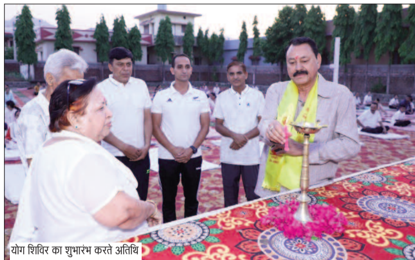
योग शिविर का शुभारंभ करते अतिथि