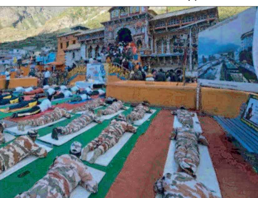
गोपेश्वर। अंतर्राष्ट्रीय योग दिवस के अवसर पर श्री बदरीनाथ धाम में भव्य एवं प्रेरणादायक योग कार्यक्रम का आयोजन किया गया।

स्वास्थ्य विभाग तथा अन्य संबंधित विभागों एवं स्थानीय नागरिकों ने संयुक्त रूप से सहभागिता कर योगाभ्यास किया।