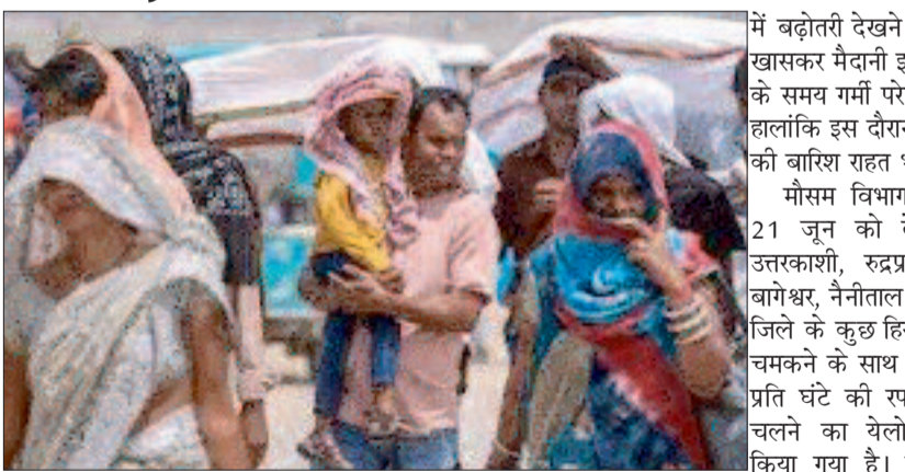
देहरादून। उत्तराखण्ड में मानसून से पहले गर्मी अपने तेवर दिखाएगी। चटक धूप खिलने से सामान्य तापमान

में बढ़ोतरी देखने को मिलेगी। खासकर मैदानी इलाकों में दिन के समय गर्मी परेशान करेगी। हालांकि इस दौरान हल्की दौरे की बारिश राहत भी दिलाएगी। मौसम विभाग की मानें तो 21 जून को देहरादून समेत उत्तरकाशी, रुद्रप्रयाग, चमोली, बागेश्वर, नैनीताल और पिथौरागढ़ जिले के कुछ हिस्सों में बिजली चमकने के साथ 50 किलोमीटर प्रति घंटे की रफ्तार से तूफान चलने का येलो अलर्ट जारी किया गया है। इसके अलावा पर्वतीय जिलों के कुछ इलाकों में हल्की बारिश के आसार हैं।