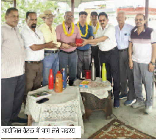
आयोजित बैठक में भाग लेते सदस्य

जयन्त प्रतिनिधि। कोटद्वार: सामाजिक समिति ने पर्यावरण संरक्षण में योगदान देने का संकल्प लिया है। इसके तहत जुलाई माह से विभिन्न ब्लॉकों में पौधारोपण अभियान चलाया जाएगा।