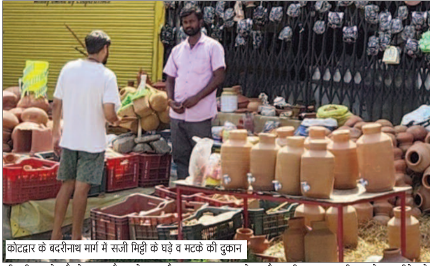
कोटद्वार के बंदीनाथ मार्ग में सजी मिट्टी के घड़े व मटके की दुकान

गर्मी के मौसम में सबसे ज्यादा ठंडे पानी की इच्छा होती है। लिहाजा गर्मियों में मिट्टी के मटके और सुराही की डिमांड बढ़ने लगती है। अब तो बाजार में मटके के साथ मिट्टी की बोटल भी खूब बिक रही है। इन बोटलों को व्यक्ति अपने बैग में रख आफिस या सफर में भी आसानी से लेजा सकते हैं। बच्चों के लिए स्पेशल मिट्टी के गिलास व बोटल भी बाजार में उपलब्ध है। मटका व सुराही विक्रेताओं ने बताया कि समय के साथ मिट्टी के बर्तनों में भी परिवर्तन किया गया है। पहले बिना ढक्कन वाली मिट्टी की बोटल आती थी। जिसे हम केवल घर की टेबल में रख सकते थे। लेकिन, अब इसमें ढक्कन भी लगाया गया है। साथ ही मटके में भी टैटी लगवाई गई है। टैटी वाले मटके की कीमत साढ़े चार सौ रुपये है। जबकि, बोटल