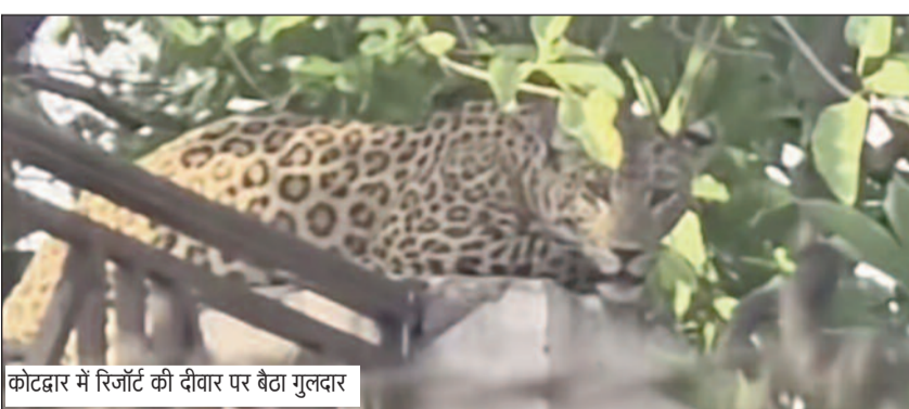
कोटद्वार में रिजॉर्ट की दीवार पर बैठा गुलदर

कैटीआर वन प्रभाग के स्वागतो केंद्र के समीप शनिवार रात एक युवक पर गुलदर ने हमला कर दिया। युवक के हाथ व पैर पर खरोंच आईं। आसपास मौजूद लोगों के शोर मचाने पर गुलदर जंगल की ओर भाग गया। बताया जा रहा है कि नेपाली मूल का एक युवक जो अक्सर सिद्धबली मंदिर और स्वागतो केंद्र क्षेत्र के आसपास घूमता रहता है। शनिवार रात करीब 10 बजे निर्माणाधीन हस्तशिल्प बाजार परिसर में मौजूद था। इसी दौरान अचानक एक वन्यजीव ने उस पर हमला कर दिया। युवक को चीख-पुकार सुनकर रात में टहल रहे लोग मौके पर पहुंचे और शोर मचाया जिससे वन्यजीव वहां से भाग गया। प्रत्यक्षदर्शियों के अनुसार युवक पर हमला करने वाला जानवर गुलदर था। हमले में युवक के पैरों पर मामूली चोटें और खरोंचें आईं। युवक