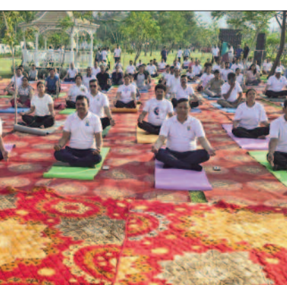
सामूहिक योग कर स्वस्थ जीवन का संदेश दिया। कार्यक्रम के अंत में एमडीडीए उपाध्यक्ष बंशीधर तिवारी ने योग प्रशिक्षकों को प्रशस्ति पत्र प्रदान कर सम्मानित किया तथा योग जागरूकता के लिए उनके योगदान की

देहरादून। प्रधानमंत्री नरेंद्र मोदी द्वारा योग को वैश्विक पहचान दिलाने व जन-जन तक पहुंचाने के अभियान और मुख्यमंत्री पुष्कर सिंह धामी द्वारा उत्तराखण्ड को योग, वेलनेस एवं प्राकृतिक चिकित्सा की राजधानी बनाने के प्रयासों के बीच अंतरराष्ट्रीय योग दिवस पर देहरादून का सिटी फॉरस्ट पार्क स्वास्थ्य, आध्यात्म और प्रकृति के अद्भुत संगम का साक्षी बना। मसुरी-देहरादून विकास प्राधिकरण ज़रमंडीडीएन द्वारा सिटी फॉरस्ट पार्क में आयोजित 12वें अंतरराष्ट्रीय योग दिवस कार्यक्रम में बतौर मुख्य अतिथि राज्य के मुख्य सचिव आनंद वर्धन ने शिरकत की। इस दौरान मुख्य सचिव व अन्य प्रशासनिक अधिकारिगण अपर सचिव मुख्यमंत्री एवं एमडीडीए के उपाध्यक्ष बंशीधर तिवारी, एमडीडीए के सचिव मोहन सिंह बर्निया, प्राधिकरण के अधिकारी-कर्मचारी, विभिन्न संस्थाओं के प्रतिनिधि तथा बड़ी संख्या में स्थानीय नागरिक शामिल हुए। कार्यक्रम में प्रकृति की हरियाली और पहाड़ों की शांत वादियों के बीच एक हजार से अधिक लोगों ने