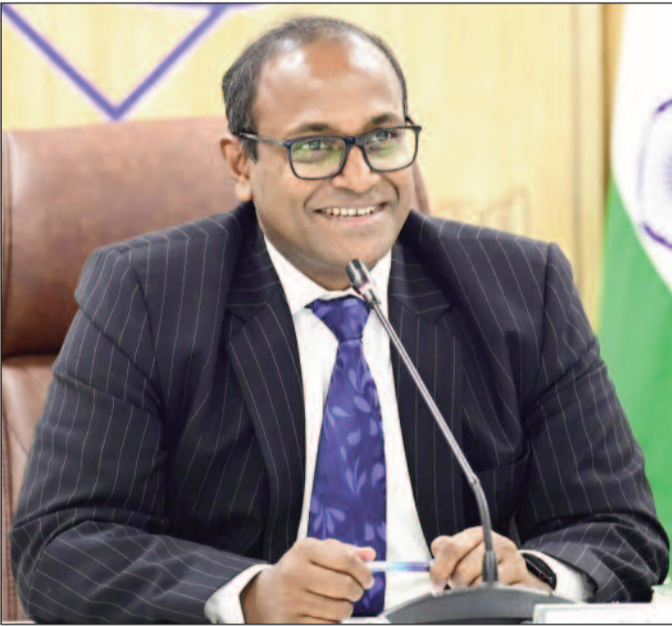
अपनी कॉल बुक कर सकते हैं। कॉल बुक करने के बाद दो दिन के भीतर बीएलओ द्वारा मतदाता से स्वयं संपर्क किया जाएगा। इसके अलावा बीएलओ के क्षेत्र भ्रमण के दौरान कोई मतदाता घर पर नहीं मिलता है तो ऐसी स्थिति में बीएलओ तीन बार घर पर विजिट करेंगे और बीएलओ घर पर स्टीकर लगाकर अपने अगले विजिट की डेट और मोबाइल नंबर लिखेंगे, मतदाताओं द्वारा बीएलओ से संपर्क कर सुविधानुसार गणना फार्म भरा जा सकता है।

मुख्य निर्वाचन अधिकारी डॉ. बी.वी.आर.सी. पुरुषोत्तम ने बताया कि प्रदेश के मतदाता नौकरी या अन्य पेशे से जुड़े होने के कारण दिन में घर पर उपलब्ध नहीं हैं तो वे "बुक ए कॉल विड बीएलओ" के फीचर से एक क्लिक पर अपने बीएलओ के साथ कॉल बुक कर सकते हैं। इसके लिए मतदाता वेबसाइट पर विजिट