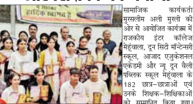
देहरादून। मेहूवाला के नया नगर में उत्तराखंड बोर्ड परीक्षा 2026 में उत्कृष्ट प्रदर्शन करने वाले होनहारों के लिए रविवार को मेधावी छात्र-छात्रा सम्मान समारोह का आयोजन किया गया।