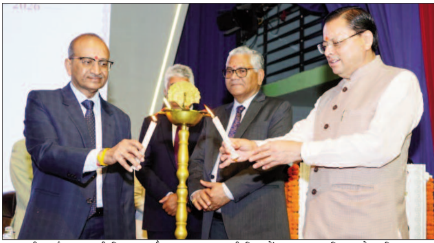
न्याय की सार्थकता उसकी निष्पक्षता और समयबद्धता में निहित है। न्याय में अनावश्यक विलंब से आमजन का विश्वास प्रभावित होता है, इसलिए न्यायिक प्रक्रियाओं को अधिक प्रभावी और समयबद्ध बनाने की दिशा में सतत प्रयास किए जाने चाहिए।

देहरादून। मुख्यमंत्री पुष्कर सिंह धामी ने यू.पी.ई.एस. बिधौली में उत्तराखंड न्यायाधीश संघ के वार्षिक सम्मेलन "जूडिशियम 2.0 : इंकलूजन्, एम्प्रेस एंड स्ट्रेथनिंग" में प्रतिभाग किया। उन्होंने कहा कि न्याय व्यवस्था को अधिक समावेशी, सुलभ, पारदर्शी एवं प्रभावी बनाना सुशासन की मूल भावना है। उन्होंने कहा कि समाज के प्रत्येक वर्ग तक त्वरित एवं निष्पक्ष न्याय की पहुंच सुनिश्चित करना राज्य सरकार की सर्वोच्च प्राथमिकताओं में शामिल है। मुख्यमंत्री ने कहा कि सम्मेलन की थीम समावेशिता, न्याय तक आसान पहुंच तथा न्यायिक संस्थाओं के सुदृढ़ीकरण जैसे अत्यंत महत्वपूर्ण विषयों पर केंद्रित है, जो विकसित भारत के निर्माण के संकल्प से भी जुड़ी हुई है। उन्होंने कहा कि न्याय व्यवस्था में समाज के प्रत्येक वर्ग को समान अवसर एवं सम्मान मिलना चाहिए तथा न्याय तक पहुंच में भौगोलिक अथवा आर्थिक परिस्थितियां बाधक नहीं बननी चाहिए। विशेष रूप से उत्तराखंड जैसे पर्वतीय राज्य में दूरस्थ क्षेत्रों के लोगों को सरल एवं सुलभ न्याय उपलब्ध कराना आवश्यक है। उन्होंने कहा कि