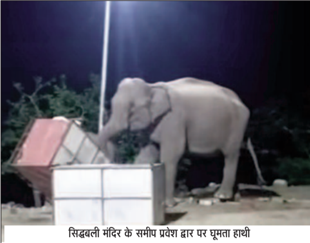
सिद्धबली मंदिर के समीप प्रवेश द्वार पर घूमता हाथी

जयन्त प्रतिनिधि। कोटद्वार : कोटद्वार श्री सिद्धबली मंदिर के समीप हाथी की धमक थमने का नाम नहीं ले रही। सोमवार रात एक बार फिर हाथी उक्त स्थान पर पहुंचा। आसपास मौजूद लोगों ने हाथी की इस चहलकदमी का वीडियो बनाया और उसे सोशल मीडिया में प्रसारित किया। श्री सिद्धबली मंदिर का अधिकांश हिस्सा जंगल से सटा होने के कारण इन दिनों हाथी अक्सर आबादी क्षेत्र तक पहुंच रहे हैं। पिछले एक सप्ताह में यह तीसरी घटना है, जब हाथी मंदिर के प्रवेश द्वार तक पहुंचा। सोमवार रात करीब साढ़े दस बजे हाथी अपने शावक के साथ पार्किंग स्थल में आया और काफी देर तक खुले मैदान में घूमता रहा। इसके बाद हाथी ने पार्किंग में रखे एक काउंटर को सूंड से उठकर इधर-उधर घुमाना शुरू कर दिया। इस दौरान शावक भी काउंटर के साथ खेलता दिखाई दिया। हाथी काफी देर तक मैदान में काउंटर को सूंड से