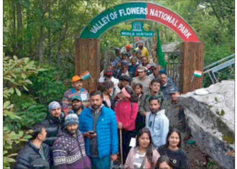
पिछले साल की तुलना में डेढ़ गुना अधिक पर्यटक भ्रमण करने पहुंचे हैं। इस साल घाटी में अभी तक 7,294 पर्यटक यहां आ चुके हैं, इसमें 34 विदेशी पर्यटक भी शामिल हैं। जबकि पिछले साल इस अवधि में 3,893 पर्यटक पहुंचे थे।

ज्योतिमंठ। विश्व धरोहर फूलों की घाटी में इस साल एक माह के भीतर डेढ़ गुना अधिक पर्यटक पहुंचे हैं। घाटी में लगातार पर्यटकों की संख्या में बढ़ोतरी की जा रही है। इससे वन विभाग में खुशी का माहौल है। नंदा देवी राष्ट्रीय पार्क के अंतर्गत फूलों की घाटी एक जून से पर्यटकों के लिए खोली गई। इस साल मौसम काफी अनुकूल बना रहा। इस कारण घाटी में पर्यटकों की संख्या लगातार बढ़ रही है जबकि घाटी का अब पीक सीजन आने वाला है। जुलाई और अगस्त माह के दौरान घाटी में सबसे अधिक फूल खिलते हैं। इसी दो माह में यहां सर्वाधिक पर्यटक पहुंचते हैं। इस साल जिस तरह से एक माह के अंतर्गत पिछले साल के मुकाबले इस साल डेढ़ गुना अधिक पर्यटक पहुंचे हैं उसे देखते हुए वन विभाग को उम्मीद है कि आने वाले दिनों में यह संख्या तेजी से बढ़ेगी। यदि बरसात में सड़कें बंद नहीं हुईं तो पर्यटकों की संख्या में इजाफा होना तय है। नंदा देवी राष्ट्रीय पार्क के डीएफओ अभिमन्यु का कहना है कि फूलों की घाटी में एक माह में