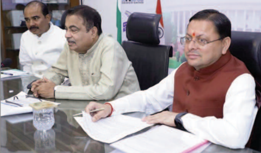
05 प्रमुख परियोजनाओं को स्वीकृति प्रदान की गई, जिनकी कुल अनुमानित लागत लगभग रुपये 2966 करोड़ है। इनमें श्रीनगर बाईपास का , पुरकाजी-लक्सर-हरिद्वार मार्ग की चार-लेनिंग, लोहाघाट एवं पिथौरागढ़

मुख्यमंत्री ने राज्य की भौगोलिक परिस्थितियों, सीमांत क्षेत्रों की सामरिक एवं रणनीतिक महत्ता, तीर्थान्त, पर्यटन, आपदा प्रबंधन की आवश्यकताओं को दृष्टिगत रखते हुए राज्य में सुदृढ़ एवं आधुनिक सड़क नेटवर्क के विकास की आवश्यकता पर बल दिया। उन्होंने राज्य के लंबित प्रस्तावों पर शीघ्र सकारात्मक निर्णय का अनुरोध किया। केंद्रीय सड़क अवसंरचना निधि के अंतर्गत वर्ष 2026-27 हेतु राज्य सरकार को लगभग रुपये 2966 करोड़ है। इनमें श्रीनगर बाईपास का , पुरकाजी-लक्सर-हरिद्वार मार्ग की चार-लेनिंग, लोहाघाट एवं पिथौरागढ़