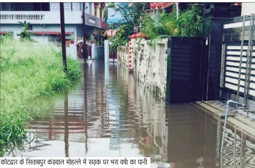
कोटद्वार के सितावपुर कंडवाल मोहल्ले में सड़क पर भरा वर्षा का पानी