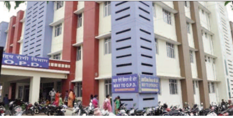
राजकीय बेस चिकित्सालय कोटद्वार