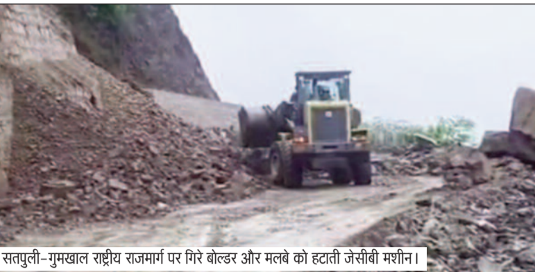
सतपुली-गुमखाल राष्ट्रीय राजमार्ग पर गिरे बोल्टर और मलबे को हटाती जेसीबी मशीन।

जयन्त प्रतिनिधि। कोटद्वार : गुमखाल-सतपुली के बीच राष्ट्रीय राजमार्ग पर बारिश के दौरान सफर करना इन दिनों बेहद जोखिमभर हो गया है। हल्की बारिश होते ही पहाड़ियों से बोल्टर और मलबा सड़क पर गिर रहा है, जिससे यातायात बार-बार बाधित हो रहा है।