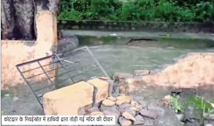
कोटद्वार के गिवाईस्रोत में हाथियों द्वारा तोड़ी गई मंदिर की दीवार

रिसर में रखा अन्य सामान भी हाथियों के उत्पात की चपेट में आ गया। हाथी काफी देर तक मंदिर परिसर में घूमते रहे, जिससे क्षेत्र में दहशत का माहौल बना रहा। इसके बाद हाथियों का झुंड पास स्थित एक बगीचे में पहुंच गया, जहां उन्होंने विभिन्न प्रजातियों के कई पेड़ों को नुकसान पहुंचाया। स्थानीय लोगों ने इसकी सूचना वन विभाग को दी। सूचना मिलते ही वन विभाग की टीम मौके पर पहुंची और काफी प्रयास के बाद हाथियों को वापस जंगल की ओर खदेड़ा।