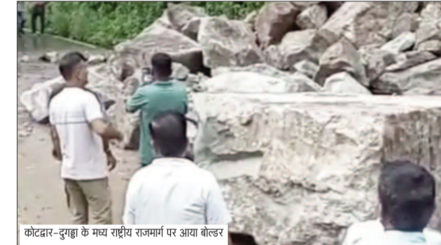
कोटद्वार-दुगड़ा के मध्य राष्ट्रीय राजमार्ग पर आया बोल्डर

लगातार बारिश का असर कोटद्वार-दुगड़ा राष्ट्रीय राजमार्ग पर भी देखने को मिला। शनिवार सुबह पांचवे मील से करीब एक किलोमीटर आगे पहाड़ी से भारी बोल्डर सड़क पर आ गिरे। सूचना मिलते ही पुलिस व प्रशासन की टीम मौके पर पहुंची और व्यवस्थाओं को बेहतर बनाने के प्रयास शुरू किए। करीब दो घंटे की कड़ी मशकत के बाद हाईवे से बोल्डरों को हटाकर यातायात शुरु किया गया। वर्षा काल में कोटद्वार-दुगड़ा के मध्य राष्ट्रीय राजमार्ग पर दस से अधिक डेंजर जोन बने हुए हैं। पहाड़ी से