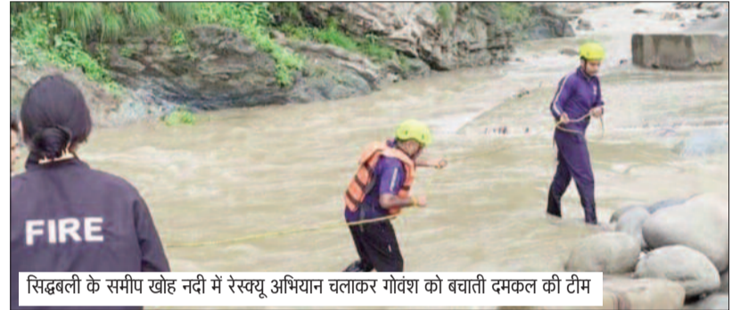
सिद्धबली के समीप खोह नदी में रेस्क्यू अभियान चलाकर गोवंश को बचाती दमकल की टीम

शनिवार सुबह दमकल को सूचना मिली कि खोह नदी में दो गोवंश फंसे हुए हैं। सूचना मिलने पर दमकल विभाग की टीम मौके पर पहुंची और करीब एक घंटे तक चले रेस्क्यू अभियान के बाद दोनों गोवंश को सुरक्षित बाहर निकाल लिया। वहीं, लगातार हो रही बारिश से