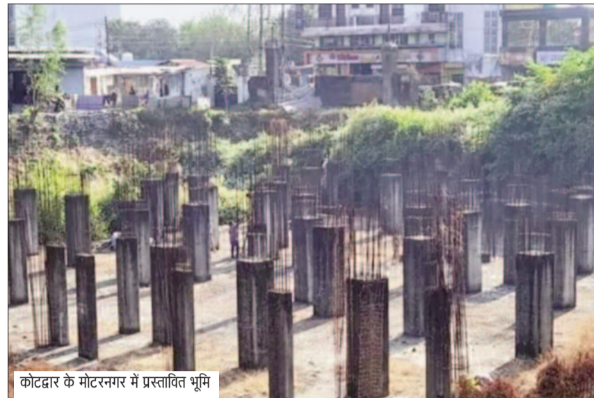
कोटद्वार के मोटरनगर में प्रस्तावित भूमि