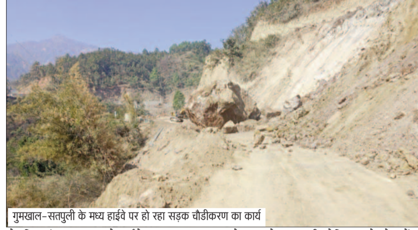
गुमखाल-सतपुली के मध्य हाईवे पर हो रहा सड़क चौड़ीकरण का कार्य

जयन्त प्रतिनिधि। कोटद्वार : नजीबाबाद-बुआखाल राष्ट्रीय राजमार्ग पर फंसे बोल्टर को ध्वस्त करने के लिए मंगलवार को राष्ट्रीय राजमार्ग पर यातायात बंद किया गया था। बोल्टर हटने के बाद हाईवे पर बुधवार सुबह से यातायात दोबारा से शुरु हो चुका है।