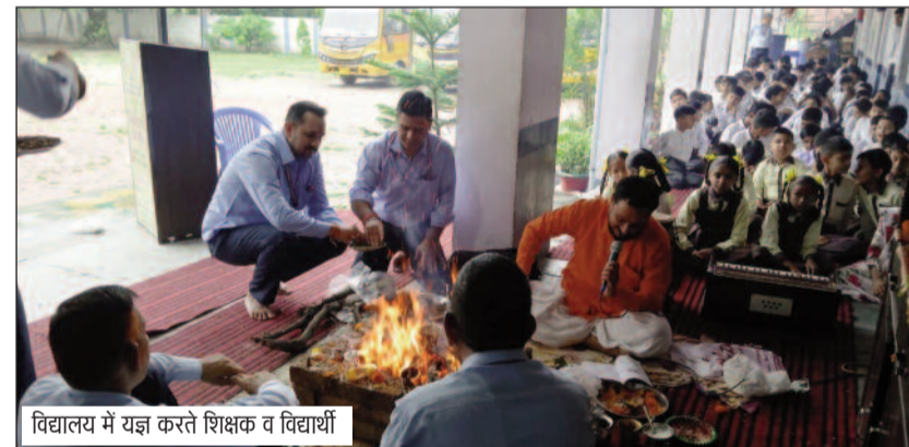
विद्यालय में यज्ञ करते शिक्षक व विद्यार्थी

जयन्त प्रतिनिधि। कोटद्वार : ग्रीष्मकालीन अवकाश के उपरंत बुधवार को सरस्वती विद्या मंदिर इंटर कॉलेज, जानकीनगर, कोटद्वार में नए उत्साह और वैदिक परंपरा के साथ शैक्षणिक कार्यों का शुभारंभ किया गया। विद्यार्थियों के पुनः विद्यालय आगमन के आत्मिक शुद्धि तथा विद्या की अखिलान्त्री में सरस्वती की कृपा प्राप्त के उद्देश्य से हवन-यज्ञ का आयोजन किया गया।