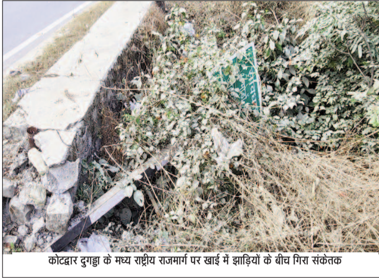
कोटद्वार दुगड्डा के मध्य राष्ट्रीय राजमार्ग पर खाई में झाड़ियों के बीच गिरा संकेतक

कोटद्वार से गुमखाल के मध्य बदहाल स्थिति में पड़ा है राष्ट्रीय राजमार्ग, कई स्थानों पर नीचे से लगातार खोखला होता जा रहा है राष्ट्रीय राजमार्ग