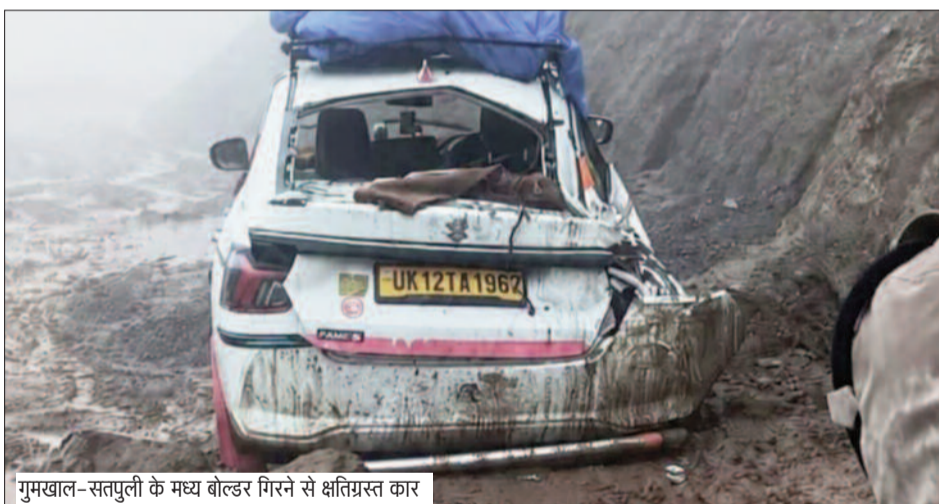
गुमखाल-सतपुली के मध्य बोल्टर गिरने से क्षतिग्रस्त कार

जयन्त प्रतिनिधि। कोटद्वार: सतपुली- गुमखाल के मध्य राष्ट्रीय राजमार्ग पर दुर्घटनाएं थमने का नाम नहीं ले रही। तीन दिन पूर्व जहां एक बोल्टर वाहन के ऊपर बोल्टर गिरने से एक व्यक्ति की मौत व दो अन्य घायल हो गए थे। वहीं, गुरुवार को भी एक कार के ऊपर बोल्टर गिर गया। हादसे में कार सवार एक ही परिवार के पांच लोगों को सुरक्षित बाहर निकाला गया।