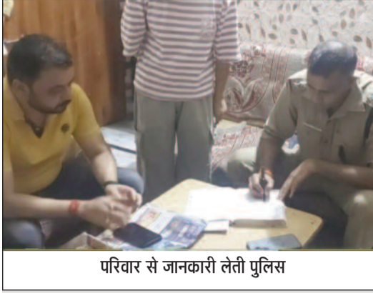
परिवार से जानकारी लेती पुलिस

गाड़ीघाट में बंद मकान से नगदी व जेवरात चोरी, पुलिस ने शुरु की जांच