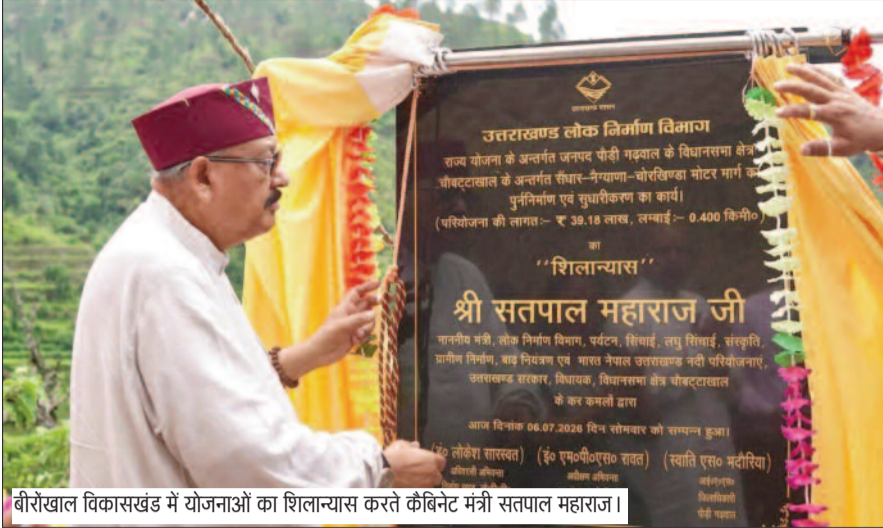
बीरोंखाल विकासखंड में योजनाओं का शिलान्यास करते कैबिनेट मंत्री सतपाल महाराज।

जयन्त प्रतिनिधि। कोटद्वार : प्रदेश के लोक निर्माण मंत्री सतपाल महाराज ने कहा कि सेवा पखवाड़ा केवल सरकारी कार्यक्रम नहीं, बल्कि सरकार और जनता के बीच विश्वास का मजबूत माध्यम है। इसके जरिए सरकार अपनी योजनाओं और उपलब्धियों को आमजन तक पहुंचाती है, वहीं लोगों को अपनी समस्याएं सीधे सरकार के सामने रखने का अवसर भी मिलता है। सोमवार को बीरोंखाल विकासखंड के दौरे पर पहुंचे सतपाल महाराज ने भस्पुर बड़ा, नेयाणा, कसगाँ, हलाड़, सैंधार, भरोलीखाल और कमलिया वल्ला सहित विभिन्न गांवों का भ्रमण किया। इस दौरान उन्होंने क्षेत्र को 3.20 करोड़ रुपये से अधिक की विकास योजनाओं की सौगात दी और कई परियोजनाओं का शिलान्यास किया। उन्होंने 2.71 करोड़ रुपये की लागत से बनने वाले भगवती तलिया-कमलिया पांच