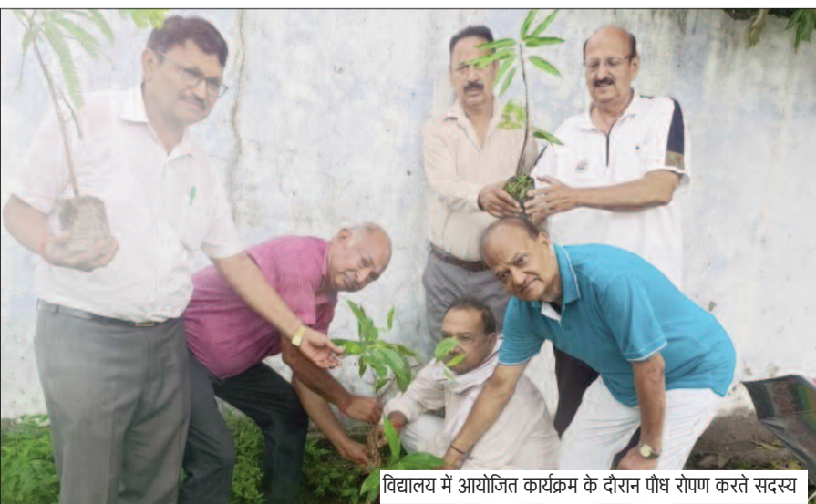
विद्यालय में आयोजित कार्यक्रम के दौरान पौध रोपण करते सदस्य

राजकीय स्नात० महाविद्यालय थलीसैण (पौड़ी गढ़वाल)