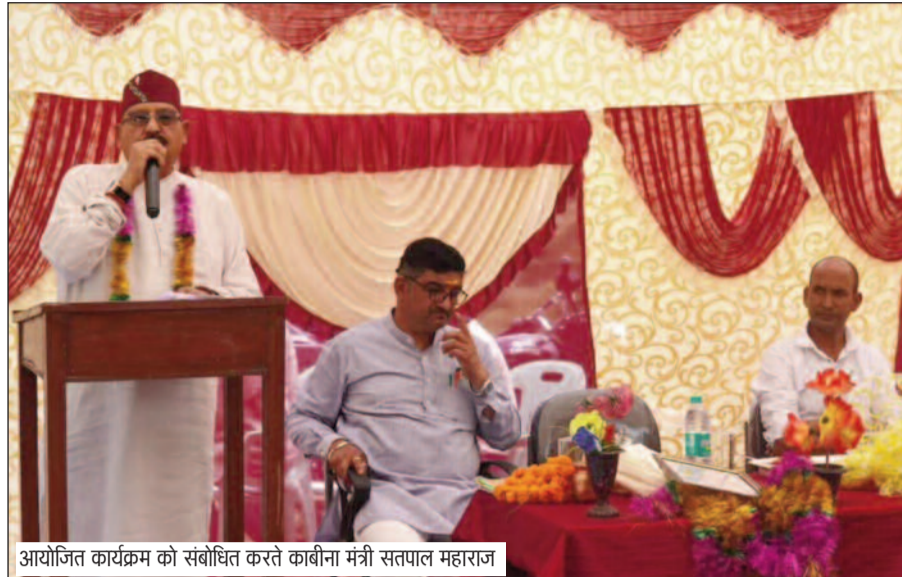
आयोजित कार्यक्रम को संबोधित करते काबीना मंत्री सतपाल महाराज

जयन्त प्रतिनिधि। कोटद्वार : चौबट्टाखाल विधायक एवं प्रदेश के कैबिनेट मंत्री सतपाल महाराज ने मंगलवार को बीरोंखाल विकासखंड के दौरे के दौरान विभिन्न विकास योजनाओं का लोकार्पण और शिलान्यास किया। इस दौरान उन्होंने करीब 4.48 करोड़ रुपये की योजनाओं की सौगात क्षेत्रवासियों को दी। उन्होंने कहा कि राज्य सरकार जनकल्याण और आधारभूत सुविधाओं के विस्तार के लिए लगातार कार्य कर रही है। सेवा पखवाड़ा कार्यक्रम के तहत आयोजित समारोह में मंत्री ने प्रधानमंत्री ग्राम सड़क योजना के अंतर्गत 4.04 करोड़ रुपये की लागत से बनने वाले खलधार-दंगा मोटर मार्ग का भूमि पूजन किया। इसके अलावा 44 लाख रुपये की लागत से डुलमोट, चंदेली, कदोला, तैलीपखोली और जाखणी ग्राम सभाओं में पंचायत भवनों के निर्माण एवं मरम्मत कार्यों का शिलान्यास तथा लोकार्पण भी किया। जनसभा को संबोधित करते हुए सतपाल महाराज ने कहा कि मुख्यमंत्री पुष्कर सिंह धामी के नेतृत्व में प्रदेश सरकार ने बीते पांच वर्षों में कई