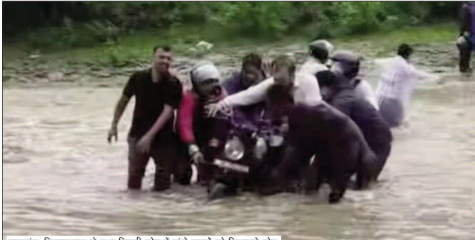
लालढांग-चिल्लरखाल के मध्य सिग्ढी स्रोत में फंसे वाहनों को निकालते लोग

जयन्त प्रतिनिधि। कोटद्वार : मंगलवार को हुई वर्षा से चिल्लरखाल-लालढांग मार्ग के बीच बहने वाले बरसाती स्रोत उफान पर आ गए। तेज जलप्रवाह के कारण इस मार्ग पर आवागमन प्रभावित रहा। सिग्ढी स्रोत में कई दोपहिया वाहन भी फंस गए थे। आसपास मौजूद लोगों ने एकजुट होकर इन वाहनों को नदी से बाहर निकाला। स्थानीय जनता पिछले कई दशकों को लालढांग-चिल्लरखाल मोटर मार्ग निर्माण की मांग उठा रही है। इसके लिए बकायदा चिल्लरखाल वन चौकी के समीप आंदोलन भी चल रहा है। ऐसे में वर्षा ने अब इस मार्ग पर आवागमन की चुनौतियों को बढ़ा दिया है। मंगलवार सुबह अचानक मार्ग के मध्य पड़ने वाले बरसाती स्रोतों का वेग