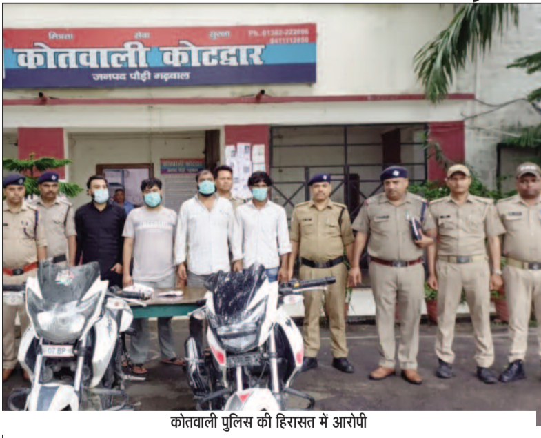
कोतवाली पुलिस की हिरासत में आरोपी

जयन्त प्रतिनिधि। कोटद्वार : शहर में बंद मकानों की रेकी कर चोरी की वारदातों को अंजाम देने वाले एक अंतरराज्यीय गिरोह का कोटद्वार पुलिस ने भंडाफोड़ किया है। पुलिस ने गिरोह के चार सदस्यों को गिरफ्तार कर उनके कब्जे से एक कार, दो मोटर साइकिल और 13 हजार रुपये नकद बरामद किए हैं। गिरोह का एक अन्य सदस्य अभी फरार है, जिसकी तलाश में पुलिस दिल्ली और उत्तर प्रदेश में दृबिश दे रही है। गिरोह का खुलासा करने वाली पुलिस